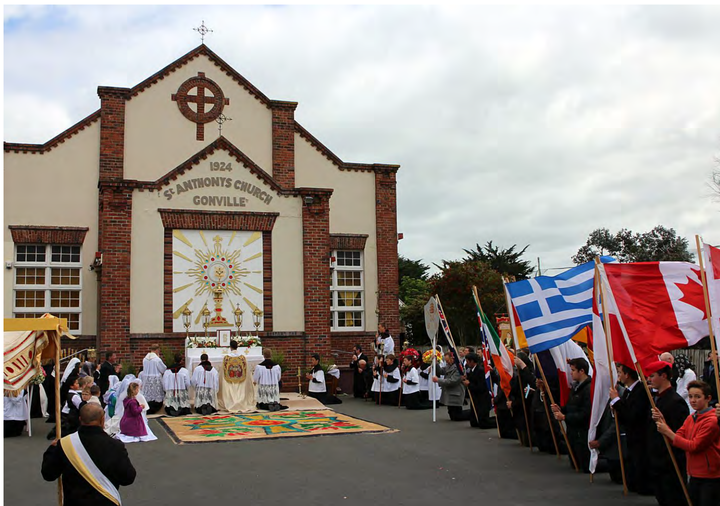
Adoration du Saint-Sacrement au reposoir devant l'église Saint Anthony à Wanganui durant la procession du Christ-Roi le 26 Octobre 2014.

- Et ces deux petites de quatre ans et demi, que le Père m'a pas voulu interroger, les trouvant trop jeunes, alors que tout le petit monde de cinq à sept ans, ayant bien répondu, est admis. Larmes, désolation des pauvres petites! Le Père parti, elles prennent une grande résolution : les voilà frappant à sa porte : « Père, interrogez-nous, vous verrez! nous voulons recevoir Jésus! - Je vous l'ai déjà dit, mes enfants, vous êtes trop jeunes, ce sera pour la prochaine fois. » Peu après, le Père se rend à l'église : qui trouve-t-il? les petites, à genoux, suppliant Jésus! A midi, ne les voyant pas revenir, les mamans les envoient chercher : elles refusent d'aller manger, et, l'après-midi, le Père les retrouve à sa porte, toujours suppliantes : « Père, interrogez-nous ». Vaincu, le prêtre cède à leurs instances, et les trouve si bien préparées, qu'il ne peut refuser Jésus à leurs petites âmes affamées!