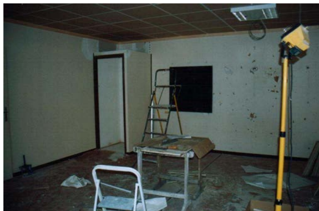
La classe de maternelle pendant les travaux

cloisons, à mettre en place les huisseries, les conduites de chauffage, l'électricité. Nous ferons nous-mêmes en temps voulu les finitions. Le chantier devrait se terminer en décembre pour le gros oeuvre.