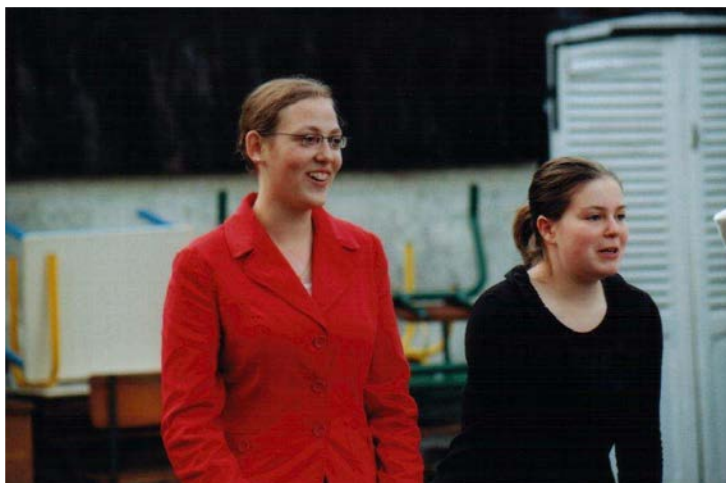
La session Bafa à Prunay