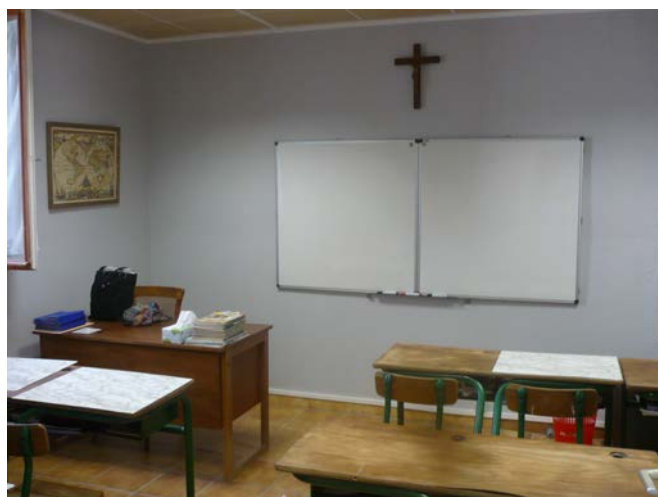
La classe de CM rénovée