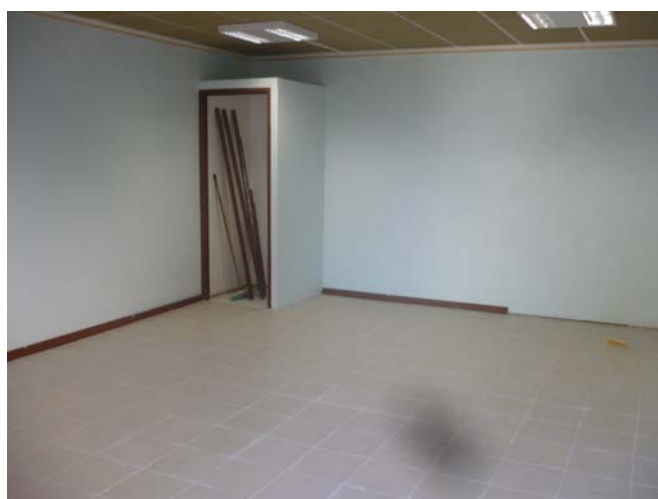
Les finitions avancent...