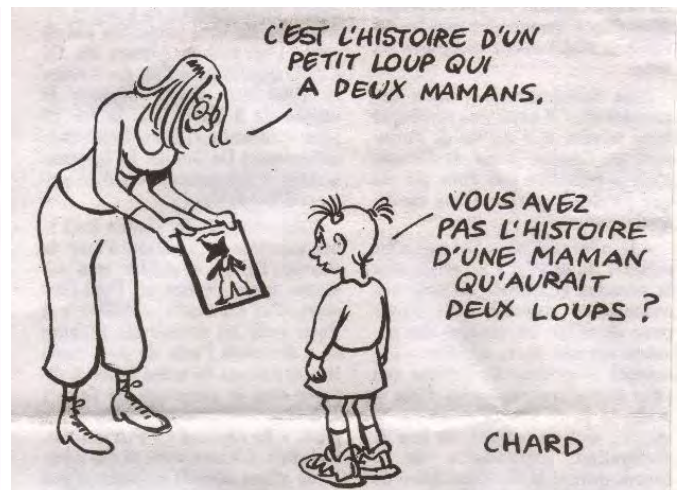
Chard (Présent du 14 septembre 2005)