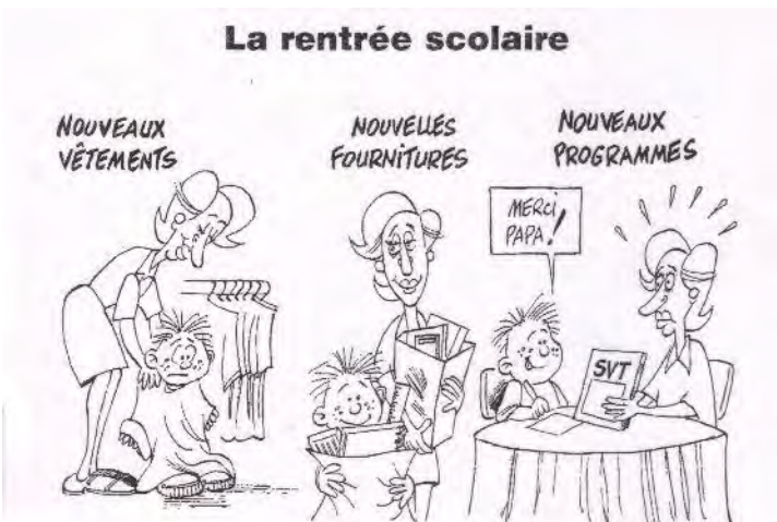
Aramis (Minute du 7 septembre 2011)