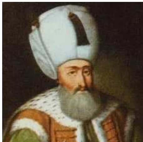
Soliman le Magnifique 1520 - 1566

Le 21 août 1557, il est élu grand maître de l'Ordre en raison de sa sagesse, de son courage et de son expérience. Les menaces d'une attaque ottomane contre l'île de Malte ne résonnent-elles pas à