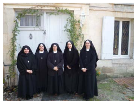
Les sœurs qui intégreront bientôt leur nouvelle maison.

Merci de nous aider à payer le remboursement l'emprunt mensuel.