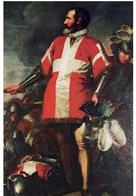
Jean Parisot de La Valette, Grand Maître de l'Ordre de Malte

De son côté, alerté de ces préparations, la Valette s'occupe activement de consolider la défense de l'île, ne craignant pas de remuer lui-même la terre pour élever des fortifications. Parallèlement à ces travaux, il demande de l'aide et des renforts auprès des princes chrétiens et du pape. Mais s'il reçut une aide financière, aucun ne voulut lui envoyer