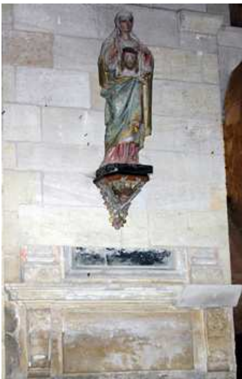
Emplacement de l'autel dédié à sainte Véronique et sur lequel on prêtait serment : Intérieur de la basilique Notre-Dame des Fins des Terres, nef centrale

N'oublions pas que la plus grande confirmation que nous avons de l'existence de ces saints et de leurs faits dans la région est la dévotion ininterrompue des fidèles, confirmée par les papes et par la liturgie propre du diocèse de Bordeaux : elle fête saint Martial le 3 juillet, sainte Bénédicte ou Benoîte, le 8 juin . Des reliques de sainte Véronique et de sainte Bénédicte sont conservées à la basilique Saint-Seurin à Bordeaux. Nous en reparlerons dans le prochain article, l'histoire la plus ancienne de l'église de Bordeaux se trouve mystérieusement contenue dans cette basilique, appelée Saint-Etienne jusqu'au VI e siècle.