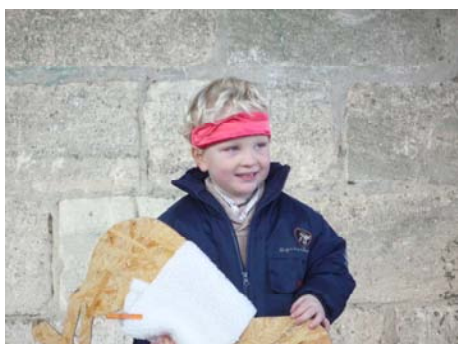
Pendant la représentation