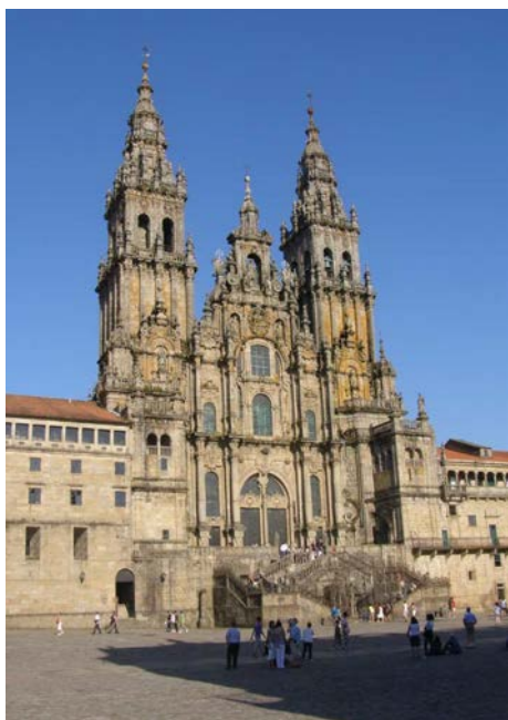
Basilique Santiago de Compostella

Tous les pèlerins de 2004 à Santiago, autrement dit Saint Jacques de Compostelle s'en souviennent encore avec émotion. Bien sûr, ceux de 2006 puis 2008 et 2010 n'ont rien oublié non plus. Pour de nombreuses raisons, il n'y a pas eu de pèlerinage organisé en 2012 mais nous reprendrons le « camino », c'est-à-dire le chemin de Compostelle en juillet 2013.