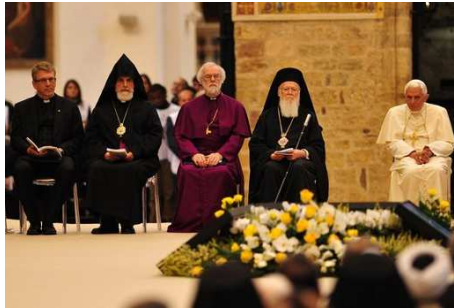
Octobre 2011 : le pape Benoît XVI célèbre les 25 ans d'Assise

Par conséquent, les catholiques ne doivent nullement écouter les non-catholiques pour en suivre quelque enseignement, comme la vérité ne peut pas être enseignée par l'erreur. Tout ce que l'Eglise peut dire aux non-catholiques, c'est de les appeler à se convertir.