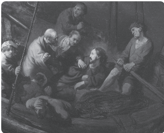
UN MOYEN HABILE...

François entend instaurer cette démocratie comme une « dimension constitutive de l'Église » que Dieu a constituée monarchique (DS 861). Cet enseignement concorde étrangement avec la présentation moderniste de l'Église condamnée par Pascendi : « Qu'est ce que l'Église ? La fille de la conscience commune, ou un accord des consciences particulières. [...] Comme l'Église, l'autorité ecclésiastique naît de la conscience religieuse et demeure en celle-ci. [...] Il revient à l'autorité ecclésiastique d'employer les formes démocratiques, à moins d'instaurer la guerre au sein même des consciences. » 1