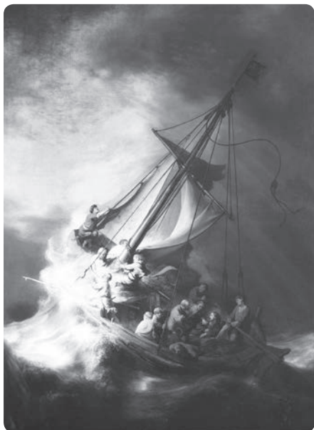
EGLISE ENSEIGNANTE - EGLISE ENSEIGNÉE

Quant à l'adhésion unanime des fidèles à des vérités, elle est certes un critère infaillible, mais entendu dans un sens passif, car elle est le fruit d'un enseignement unanime de la hiérarchie. 1