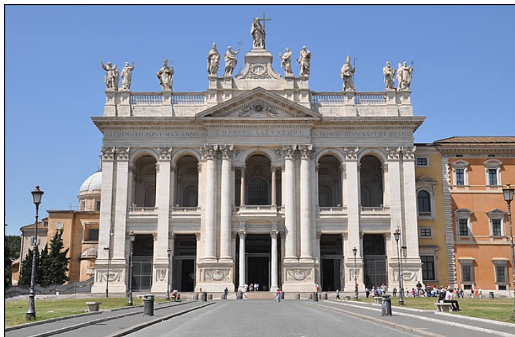
Saint-Jean de Latran, cathédrale de Rome

De même que saint Pierre et les autres Apôtres constituent, de par l'institution du Seigneur, un seul collège apostolique, sembla-