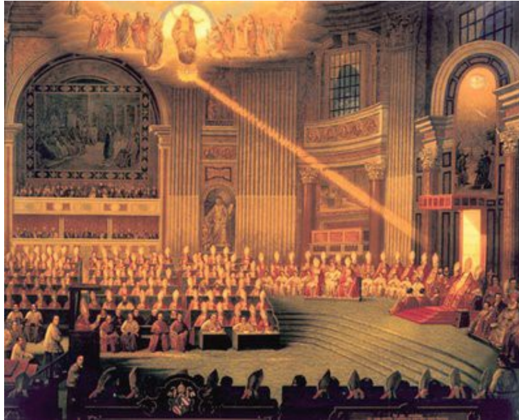
Le Concile Vatican I

En conséquence, Nous enseignons et déclarons que l'Église romaine possède sur toutes les autres, par disposition du Seigneur, une primauté de pouvoir ordinaire, et que ce pouvoir de juridiction du Pontife romain, vraiment épiscopal, est immédiat. Les pasteurs de tout rang et de tout rite et les fidèles, chacun séparément ou tous ensemble, sont tenus au devoir de