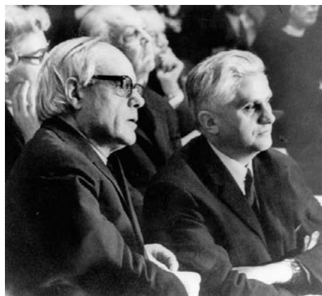
Deux experts au Concile : les Pères Rahner et Ratzinger

« Les Pontifes romains, selon que l'exigeaient les conditions des temps et des choses, tantôt convoquèrent des conciles œcuméniques ou sondèrent l'opinion de l'Église répandue sur la terre, tantôt par des synodes particuliers, tantôt grâce à des moyens que leur fournissait la Providence, ont défini qu'on devait tenir ce qu'ils reconnaissaient, avec l'aide de Dieu, comme conforme aux saintes