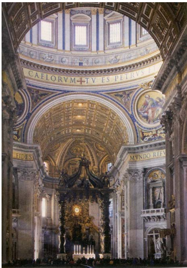
La coupole de Saint-Pierre de Rome porte les paroles de Notre-Seigneur : Tu es Petrus.

Leur doctrine apostolique a été reçue par tous les Pères vénérés, révérencée et suivie par les saints docteurs orthodoxes. Ils savaient parfaitement que ce siège de Pierre demeurerait pur de toute erreur, aux termes de la promesse divine de notre Seigneur et Sauveur au chef de ses disciples : "J'ai prié pour toi, pour que ta foi ne défaille pas ; et quand tu seras revenu, affermis tes frères" [Lc 22, 32].