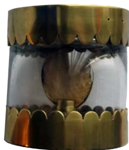
Relique de saint Loup