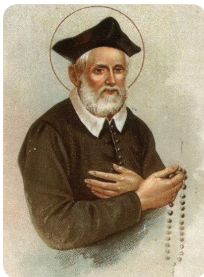
Saint Philippe Néri, apôtre de la joie, fêté le 26 mai

La tristesse tu banniras De toi, impitoyablement.