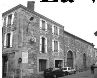
Eglise SAINT JEAN L'EVANGELISTE