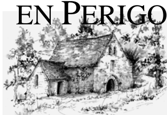
Sanctuaire N.-D. de FONTPEYRINE