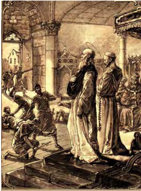
Intrépidité des bienheureux Robert d'Arbrissel et Bernard de Tiron au concile de Poitiers