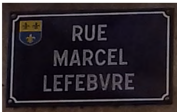
Dans le Nord, on tient la bonne route (photo prise à Merville)

saint canonise les vertus de ce saint et le culte qu'on doit lui rendre, de même le pape dominicain et le concile de Trente « ont simplement constaté que depuis déjà de nombreux siècles – la plupart des prières remontant aux temps apostoliques –