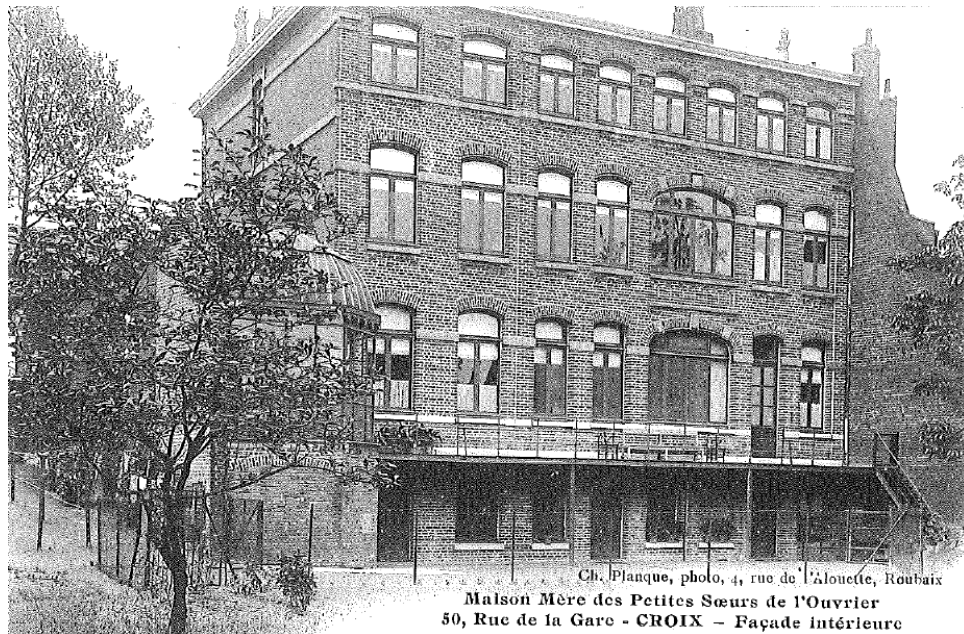
Maison Mère des Petites Sœurs de l'Ouvrier 50, Rue de la Gare - CROIX - Façade intérieure

Le Foyer du boulevard de Metz ferme en 1937.