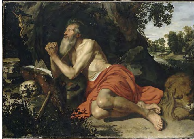
Saint Jérôme en prière de Artus Wolffort (1581-1641), palais des Beaux Arts de Lille

crucifié leur chair avec ses vices et ses convoitises. » (Gal. 5, 24) La pratique de la pénitence va atténuer nos inclinations vicieuses et nous faire triompher du péché.