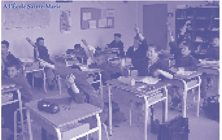
A l'École Sainte-Marie

sont dévoués avec ardeur, mais aussi encourager les parents à continuer dans ce sens. Il veut enfin convaincre les hésitants, voire les dubitatifs.