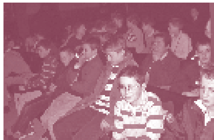
Sortie des enfants de Chœur de Saint-Nicolas partis voir une représentation de la Passion.

Église Saint-Nicolas du Chardonnet - 23, rue des Bernardins - 75005 Paris Tél. 01 44 27 07 90 - Fax 01 43 25 14 26