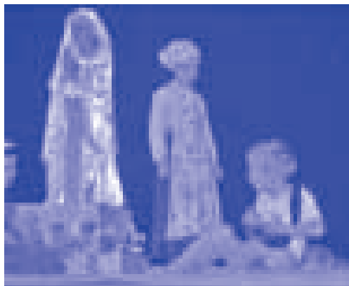
Saynète des élèves du petit Saint-Bernard lors d'une kermesse de Saint-Nicolas

L'accord entre les parents et l'école sur ce point reste fondamental, notamment