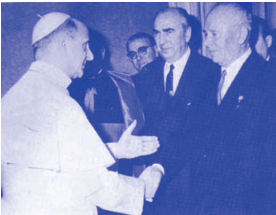
Nicolai Podgorny, le numéro 2 de l'URSS communiste, reçu par Paul VI, sans conditions, sans demande de « changement d'attitude ».

12 juillet: Mgr Lefebvre rend publique , en la communiquant à l'AFP, sa troisième lettre à Paul VI (22 juin) ; dans une note préliminaire, il dit : « Qu'on ne s'y trompe pas, il ne s'agit pas d'un différend entre Mgr Lefebvre et le pape Paul VI. Il s'agit de l'incompatibilité radicale entre l'Eglise catholique et l'Eglise conciliaire, la messe de Paul VI représentant le symbole et le programme de l'Eglise conciliaire. »