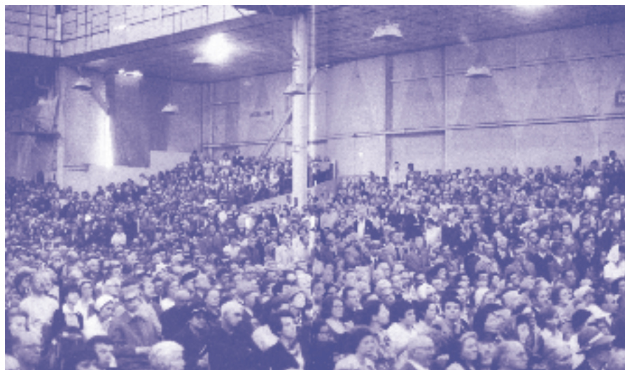
La messe du 29 août à Lille. Une salle comble.