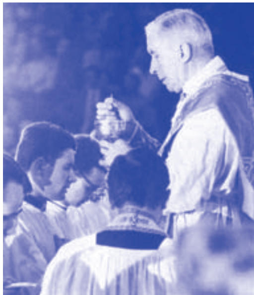
A Lille, le 29 août.

sition systématique » induit l'idée d'un manque total de distinction, d'un refus non fondé et donc peu légitime. Or, s'il est un évêque qui a fait les distinctions nécessaires pour séparer le bon grain de l'ivraie, pour ne condamner que les erreurs, c'est