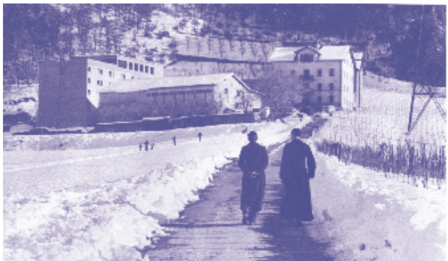
Le séminaire d'Ecône, en 1976, 20 ans avant la construction de l'église.

Si l'été 1976 a été l'occasion de faire connaître Mgr Marcel Lefebvre, son action et son œuvre au monde entier, il n'aura été que l'aboutisse-