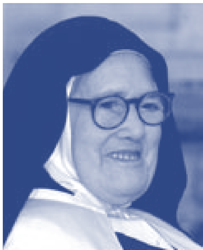
Sœur Lucie, la dernière voyante vient de s'éteindre.

98 ans, un âge plus qu'honorable. Pour une âme qui a beaucoup souffert, c'est même exceptionnel ; cette longévité a un côté mystérieux que l'avenir nous dévoilera peut-être. L'histoire de la théophanie de Fatima est tellement liée au