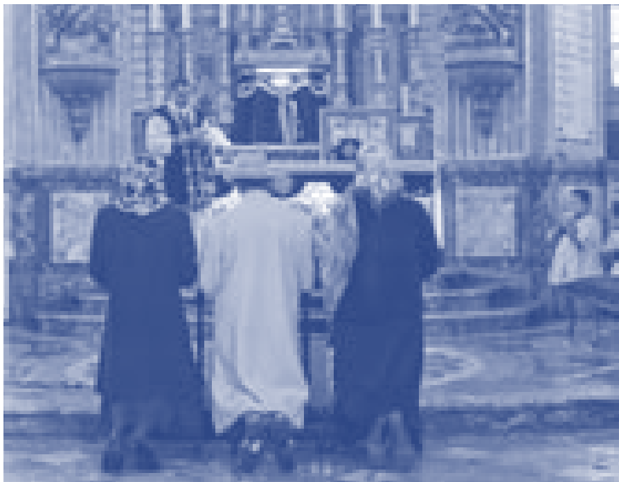
Engagements dans le Tiers-Ordre de la Fraternité sacerdotale Saint-Pie X, dimanche 27 février.

Saint-Paul qui n'est pas seulement une église mais aussi tout un quartier important de Paris, est ouverte tous les jours et vaut véritablement un détour. ☒