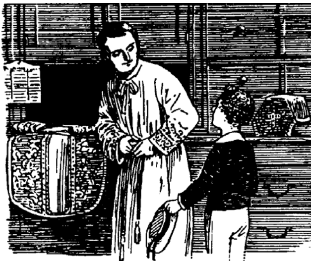
Mon Père, que faut-il faire pour se donner à Dieu ?

vous consultez un prêtre, il fera de vous un " curé ! ". Non, la chose est