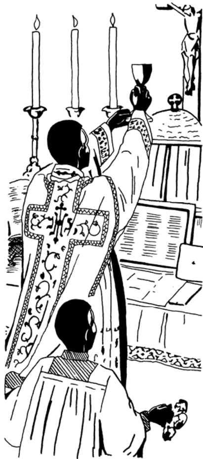
Le Saint Curé d'Ars disait souvent : " Si nous savions ce que c'est la Messe, nous mourrions de bonheur ! "