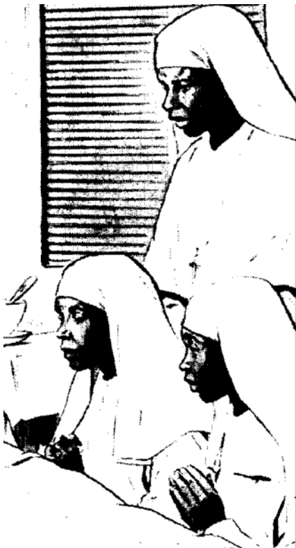
« Les religieuses, par leurs activités paroissiales, éducatives ou hospitalières, accomplissent un généreux travail au service de la population. » Jean Paul II

La part la plus importante est faite aux problèmes que causent les dérèglements de la loi du mariage. En premier lieu les problèmes liés au respect de la vie, il faut s'occuper des familles pour " promouvoir le témoignage de foi des couples par une existence en conformité avec la loi divine sous tous ses aspects ". En second lieu l'éducation des enfants qui seront les générations futures ; le pape poursuit :