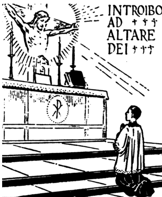
QUI ES-TU DONC, PRÊTRE SUR LA TERRE ? L'écho du Cœur Sacerdotal de Jésus, la continuation, le prolongement, la présence même de l'unique prêtre éternel.

Et comment ce seul prêtre arrive à accomplir cette œuvre unique et gigantesque ? Par un drame, par un acte, par une œuvre qui nous coupe le souffle : c'est le Calvaire ! Je vous prie, regardez le prix, regardez le prêtre, le médiateur en action, regardez son sang couler sur nos fronts, dans nos cœurs. Regardez ses blessures, ses souffrances infinies, son Cœur transpercé, sa couronne d'épines, son corps détruit. UN ÉTERNEL SACRIFICE, accompli par UN PRÊTRE UNIQUE ! C'est cela le centre du monde, c'est cela l'unique planche du salut. C'est cela la chose