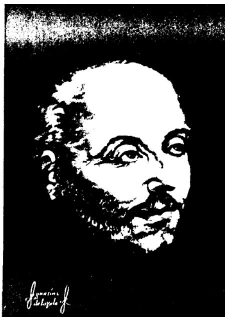
Saint Ignace le Loyola, auteur providentiel du livre des Exercices

Attention: les places sont limitées ! Renseignez-vous à la porterie.