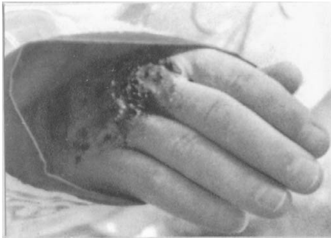
La main du saint Padre Pio portant les marques (stigmates) de la Passion de Notre Seigneur Jésus-Christ. - L'Eglise catholique compte plusieurs centaines de stigmatisés depuis le premier cas connu, qui est celui de saint François d'Assise (fête le 17 sept.) !

Pendant le carême 1926 apparurent les stigmates des plaies du