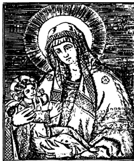
Secours des chrétiens. Reine des Anges. — Priez pour nous !

La section des prières s'est vu augmentée encore par d'autres ajouts, dont le plus vaste est certai-