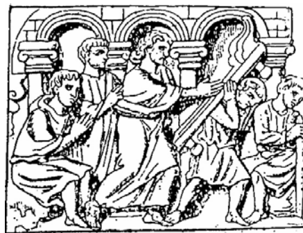
Le paralytique guéri, emporte son lit, et Jésus le bénit.

mais étant donné le foyer de convoitises qui demeure dans notre chair, la réussite ne peut être continue et totale. Il y a des chutes ; il y aura des rechutes. Mais dans la mesure où l'on continue à se complaire dans la Loi de Dieu et à avoir faim et soif de justice, ce ne sont que des fautes isolées et sans perversité, et où l'on conserve la vie éternelle. Puis donc que, de toute façon, on ne sera jamais des standard , des gens bien comme il faut, appliquons-nous à rester les bons amis du bon Dieu, à combattre