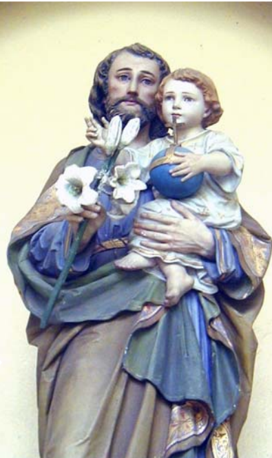
Saint Joseph saura aider les âmes de bonne volonté à revenir à Dieu. (Statue du cloître de la Mission)

Dieu, ni de ses dix commandements, pas plus que je ne veux libérer ma voiture de la gazoline et des lois de la gazoline, car sans gazoline qui brûle selon les lois chimiques ma voiture n'irait pas du tout. Je ne veux pas être égal à tout le monde, car Dieu fait toutes choses avec ordre et hiérarchie, et Il me veut en-dessous des uns et au-dessus des autres, par exemple Il veut l'épouse en-dessous de son mari et au-dessus