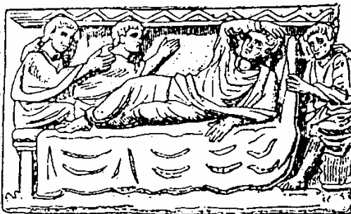
Sarcophage antique représentant la guérison du paralytique de la piscine Probatique.

Qui s'étonnerait de voir ce miraculé obéir à la lettre à celui qui vient de le guérir en disant : « Lève-toi, prends ton grabat et marche » ? Un miracle incontestable venait d'être accompli qui rendait témoignage à la puissance et à l'autorité du thaumaturge. Seulement, voilà le hic : « le sabbat tombait en ce jour-là ». Et un pharisien ne pouvait souffrir de voir un homme transgresser ce précepte divin : « Que personne ne porte un fardeau le jour du sabbat » (Néhémie XIII, 19). Voilà bien la justice des pharisiens : une justice qui s'attache à l'accomplissement scrupuleux de toutes les observances légales, les multipliant et les compliquant à l'excès, et qui « méprise les préceptes les plus graves de la Loi que sont la justice, la miséricorde et la foi » (Matthieu XXIII, 23). Evidemment, cette piété pharisaïque n'est qu'ostentation et parade. C'est une piété tape-à-l'œil , qui dissimule à peine un orgueil effréné. Mais cela importe peu au pharisien, qui pense si fort qu'on l'entend hurler : « Plus pur que moi, tu