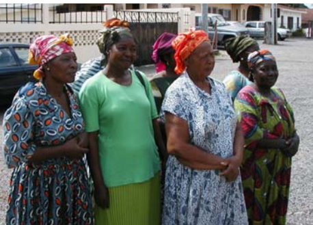
Jeudi Saint, 14h30. L'association saint Rosaire sort de sa prière. Sur invitation du Père Supérieur elles regardent admiratives, mais qu'est-ce donc ?