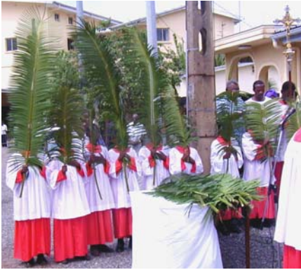
La bénédiction et la procession des Rameaux. Cherchez qui est qui... ?

Les grandes manœuvres annuelles ont commencé cette veille du jour des Rameaux 2004. Grande nouvelle : la statue tant attendue est arrivée au port vers 14h00. Patience est devenue maître mot !