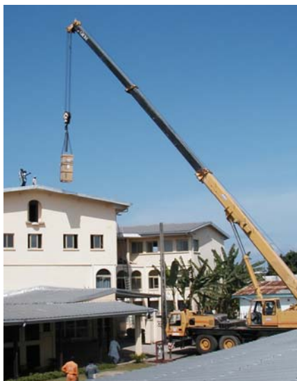
L'ange du XXI ème siècle. La vierge dans sa boîte de bois est transportée dans les airs