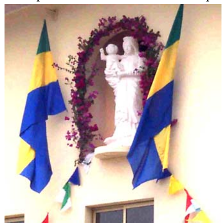
L'inauguration, le 18 avril 2004. Notre Dame de Libreville fait donner la bénédiction à son divin Fils sur le Gabon