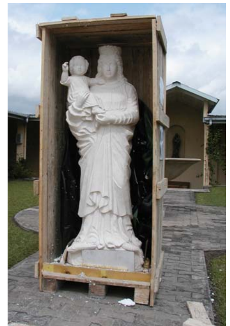
... C'est la Reine du Gabon qui sort de son écrin ! Quelle est belle, comme elle veillera sur nous !