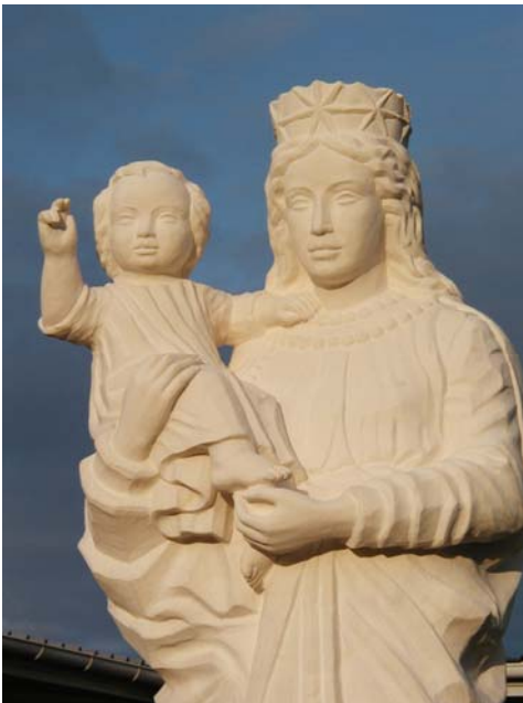
La statue de Notre Dame de Libreville, Reine du Gabon, prise en photographie avant d'être hissée par les « anges » dans la niche de la façade de la maison principale

Et c'est le Saint jour de Pâques, après la grand'messe solennelle que fut bénie la statue de Notre Dame offerte par les fidèles à l'occasion de mes 25 ans de sacerdoce – c'était le 29 juin 2001 – Il a fallu presque trois années pour trouver l'artiste sculpteur Monsieur Pierre ROUSSEAU des Rosières, un tout petit village près du Puy en Haute Loire, et réaliser l'œuvre demandée : la copie de la statue de Notre Dame de France qui domine la ville du Puy en Velay et enfin l'acheminer jusqu'à la Mission St Pie X de Libreville. L'inauguration fut grandiose le dimanche de Quasimodo devant toute l'assem-