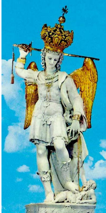
« Michel, Michel du frais matin, ornement de l'armée du Ciel. »