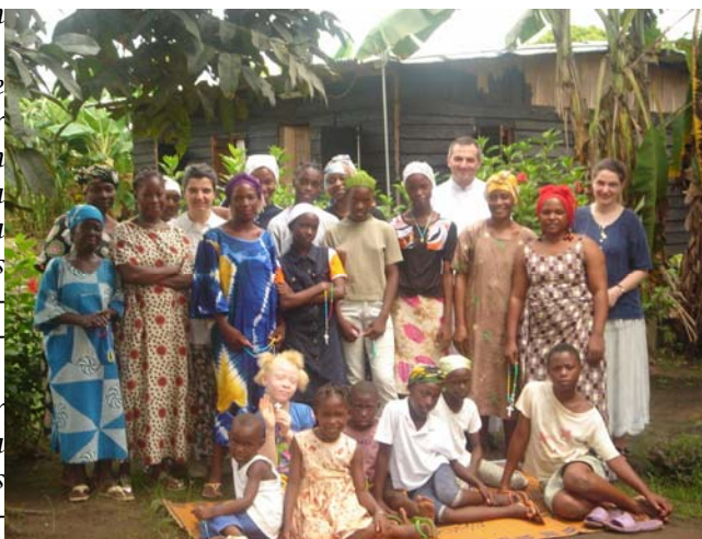
Messe à Lambaréné

Ce même jour encore, trois sœurs blanches arrivent à la mis-