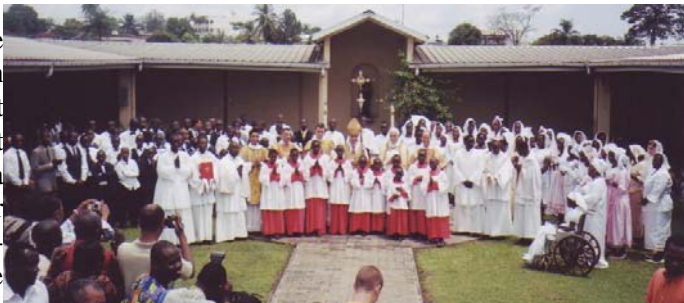
Confirmations par Mgr de Galaretta

Les premières raisons sont d'ordre naturel : nous sommes corps et âme et nous avons besoin d'exprimer extérieurement nos sentiments intérieurs par des gestes ou des actions qui