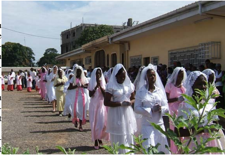
La procession des futures confirmées

Le signe, c'est son nom. La signature d'un homme est son nom : son nom est sa parole, et sa parole est son honneur. C'est pourquoi le langage dit : déshonorer son nom.