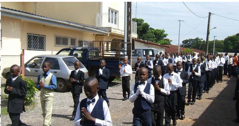
La procession des futurs confirmés

Il faut donc habituer très tôt l'enfant à aimer la vérité plus qu'il ne craint la punition. Il faut lui donner le courage d'accepter les conséquences de ses actes, par exemple en l'encourageant à accepter la punition alors même qu'on la donne : « Ce que