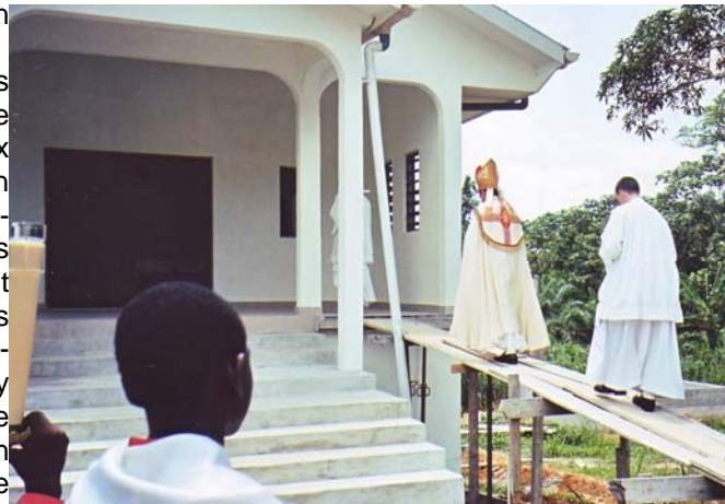
Bénédictio du prieuré à Four Place

Jésus, lui, écoute l'exposé du cas en restant tranquillement assis. Il ne répond rien. Comme quelqu'un qui n'a rien à faire et cherche à pier