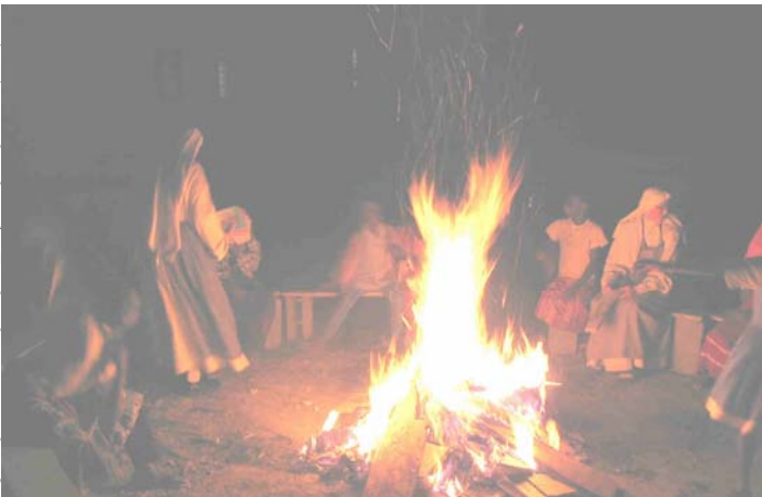
Veillée autour du feu.

Hélas ! ces gens aux vues limitées à leur famille ou village n'étaient pas disposés à recevoir cette « bonne nouvelle ». La jalousie reprend le dessus, et on ne raisonne pas des gens jaloux. Ils se mettent à reprocher ouvertement à Jésus de ne pas faire de miracle à Nazareth. Mais si Jésus refuse d'en faire, c'est précisément « à cause de leur incrédulité » (Matthieu 13, 58). C'est leur étroitesse d'esprit qui les empêche de recevoir le royaume de Dieu.