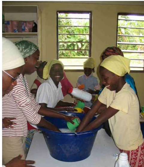
Vaisselle au camp : la bonne humeur est au rendez-vous