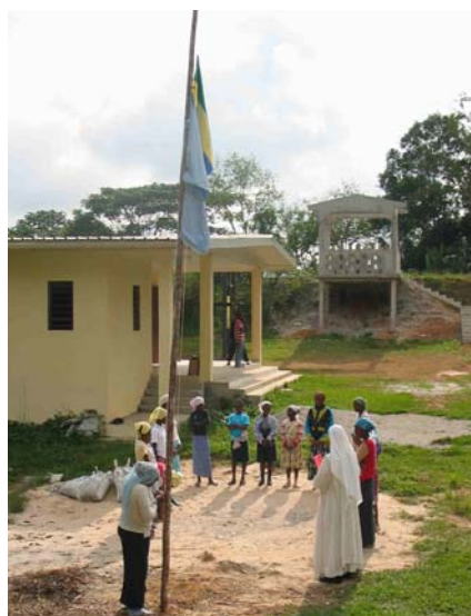
Cérémonie des couleurs

Et quelle ne fut pas la joie de Gimbi lorsque l'abbé Charles, en mars 1934, arriva au village Mayabi pour bénir cette chapelle, humble commencement de la future Mission des Masengo.