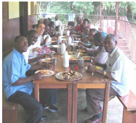
La récompense de la retraite : La réfection des corps et des âmes