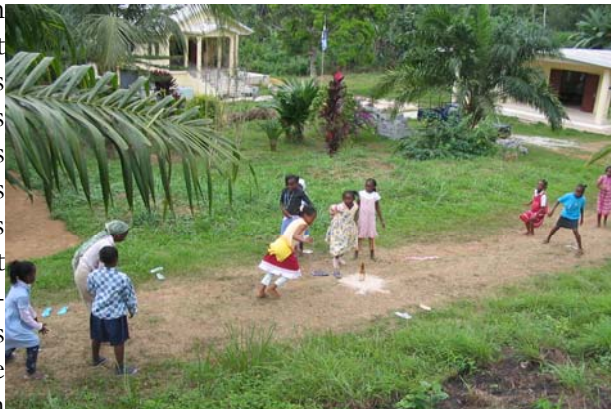
Les filles du camp en plein jeu

voir sur de nombreux petits chefs de villages. Bref, son autorité s'étendait très loin, et son nom était connu depuis chez les rudes Mitsogo de l'Ikoï jusque chez les Simba, les Pobi et les Bangomo de