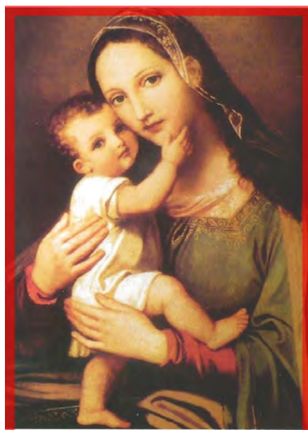
Voici votre Mère... Jn.XIX, 26.

tention de son baccalauréat, sans crier gare (parce qu'étant resté discret sur ses intentions), alors que certains s'attendaient à le voir s'engager dans des études dans l'une ou l'autre des Universités gabonaises, il opta