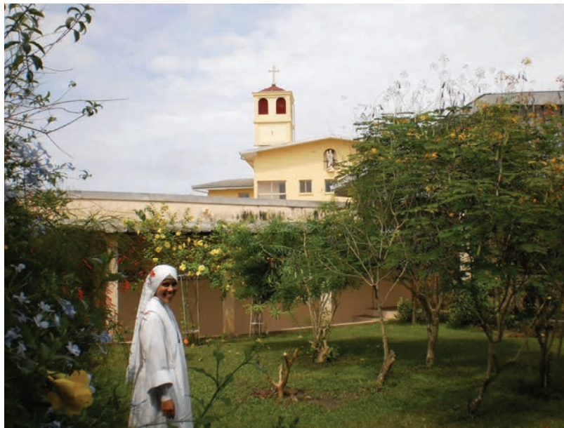
Vue du clocher depuis le jardin des sœurs...

Le prochain « St Pie » vous présentera plus amplement nos trois cloches : leurs noms, leurs caractéristiques, etc. Sinon, il n'y aurait plus de surprise, n'est-ce pas ?