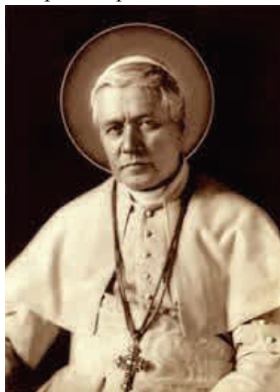
St Pie X avait dénoncé ces prêtres qui voulaient changer l'Eglise...

Que doit-elle enseigner cette Eglise, sinon la doctrine de Jésus, qui seul peut nous sauver ?