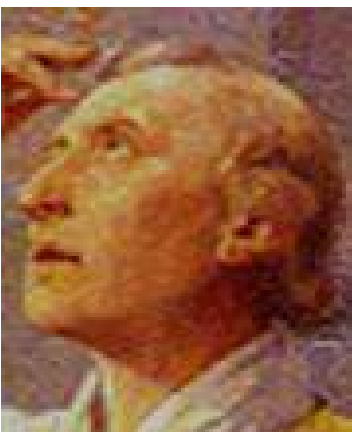
Saint Noël Pinot