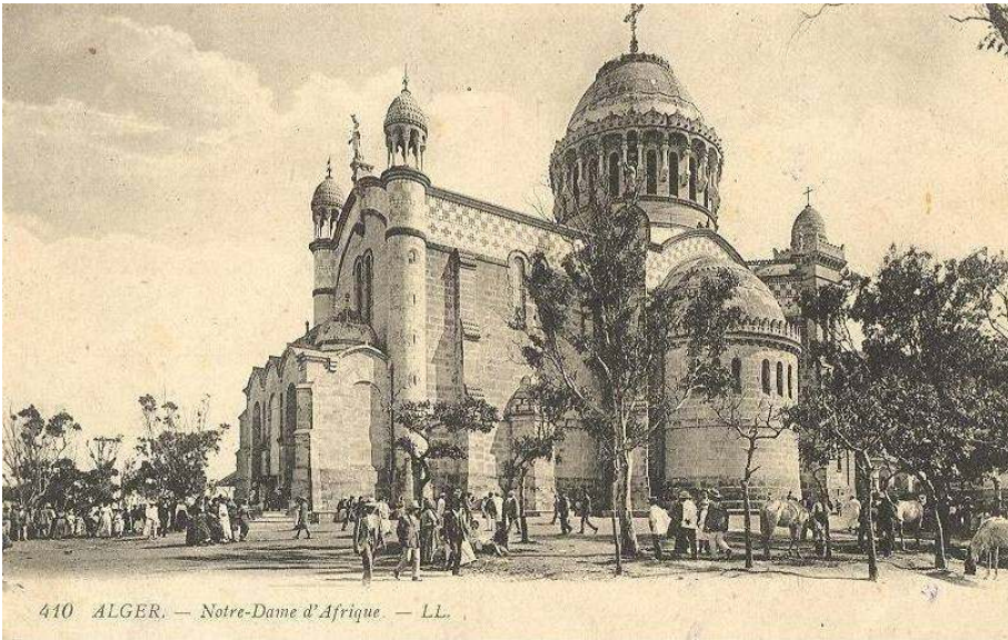
410 ALGER. — Notre-Dame d'Afrique.