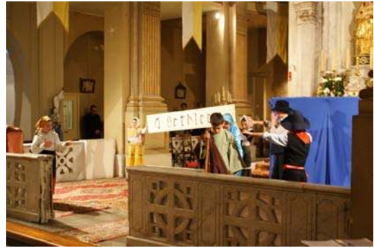
2 ème tableau : « Bethléem »

« Une jeune fillette de noble coeur Priaît en sa chambrette son Créateur L'Ange du Ciel descendit sur la Terre Lui conta le mystère du Salvateur. »