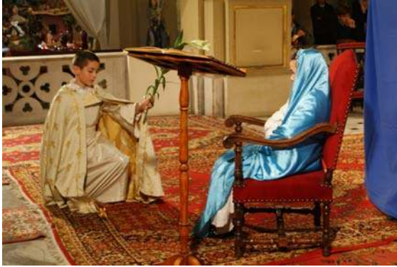
1 er tableau : « L'Annonciation »

« Une jeune fillette de noble coeur Priaît en sa chambrette son Créateur L'Ange du Ciel descendit sur la Terre Lui conta le mystère du Salvateur. »