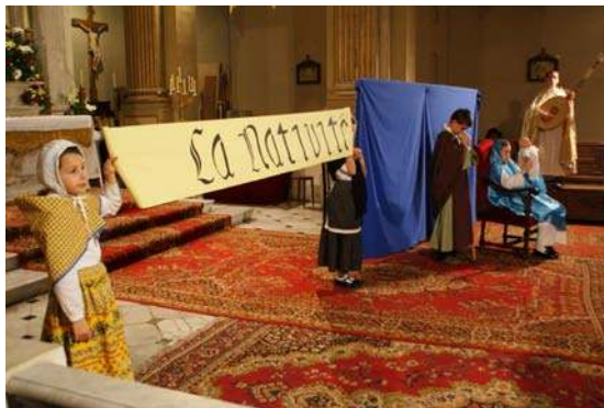
3 ème tableau : "La Nativité"

« Nous voici dans la ville Où naquit autrefois le Roi le plus habile Et le plus sûr des rois. »