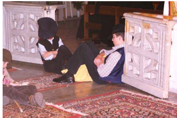
4 ème tableau : "Les Bergers"

« Que la paix soit sur Terre Que Dieu fasse pardon Et nous faisons la guerre Jour et nuit au démon. »