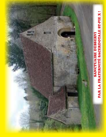
SANCTUAIRE DESSERVI PAR LA FRATERNITÉ SACERDOTALE ST-PIE X !

LE SANCTUAIRE NOTRE-DAME DE Fontpeyrine EST EN PÉRIL ET A BESOIN DE VOTRE AIDE !