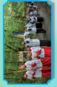
Pour se rendre à Fontpeyrine :

Vierge de Fontpeyrine Nous chantons vos vertus Votre nom est digne Votre amour pour Jésus.