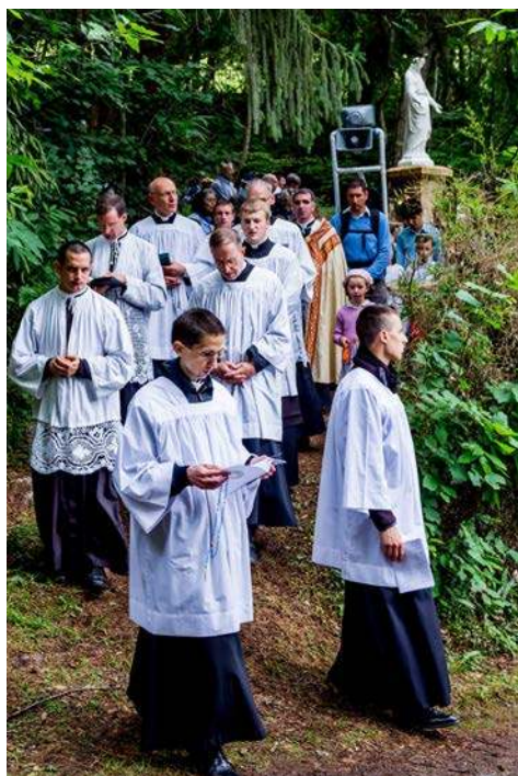
Procession du chapelet - 2 juillet 2017

Quelques mots sur Fontpeyrine à l'occasion de la fête de la Naisance de la Vierge Marie (8 septembre)