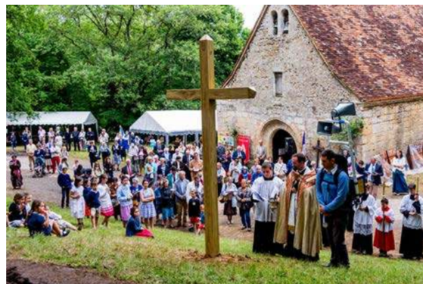
Erection de la croix du Jubilé - 2 juillet 2017

La paroisse de Tursac fait le 2 juillet de chaque année - le jour de la Visitation - une procession à la chapelle dans le but d'obtenir, par l'intercession de la Vierge, la préservation de la grêle. Cette pratique de dévotion existe depuis bien longtemps, et les vieillards