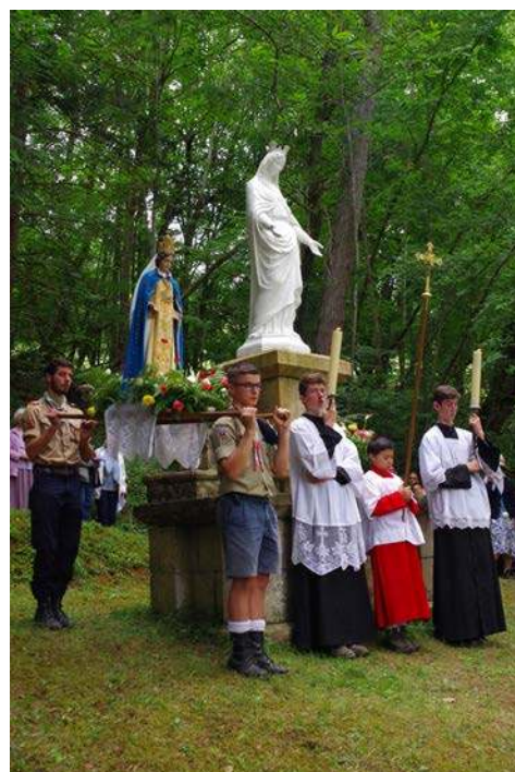
Procession du chapelet - 2 juillet 2017

Cette statue a été mutilée, la tête est séparée du corps,