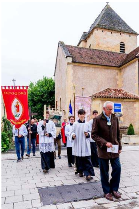
Pèlerinage depuis Tursac - 2 juillet 2017

aurait voulu faire rire ses camarades aux dépens de la décence et du respect des choses saintes. Son nom est connu 5 , et on sait aussi que, quelques temps après, la Vierge le punissait en le frappant de cécité, maladie qu'il garda toute sa vie.