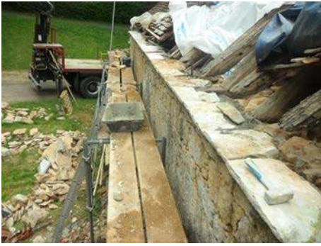
Réfection de la toiture

témoignent que, depuis bien longtemps aussi, ce fléau n'a fait aucun ravage à Tursac.