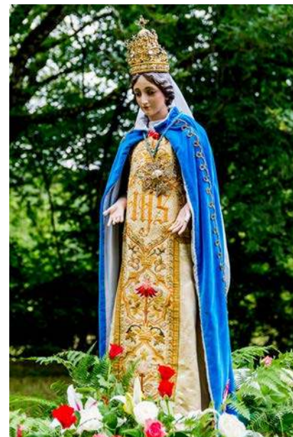
La Vierge de la procession fleurie pour l'occasion