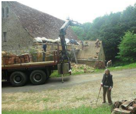
La gardienne du sanctuaire veille sur les travaux !

Le premier de ces désirs, c'est que nos nombreux pèlerins n'oublient pas au 8 septembre d'élever leurs cœurs à la hauteur de la foi la plus vive, qu'ils n'oublient pas dans la manifestation de leur piété, de se conduire en vrais pèlerins, en vrais enfants de Dieu et de Marie.