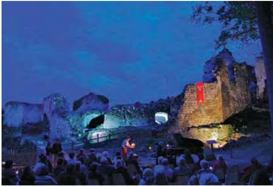
8 septembre 2017—concert spirituel à la Madeleine pour clore le jubilé