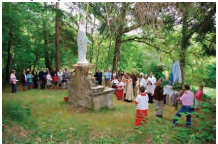
Procession du chapelet-8 septembre 2017

Tout à coup le travail semble bien s'accélérer, je me dis alors que ça va vite se faire, tant mieux... mais plus ça passe moins j'ai le temps de souffler, mon mari contrôle vers 14h je suis à une contraction de 45s toutes les minutes... c'est trop... de la chambre nous allons au service des naissances, et oui c'est trop rapide: maman ne souffle pas et surtout le cœur de bébé faiblit car lui non plus ne peut pas reprendre son énergie... le verdict tombe: césarienne en « urgence orange » ... tout s'active autour de nous et je prie comme je peux: Mon Dieu sauvez nous!! Sauvez notre bébé!! Notre Dame de Fontpeyrine!!! Mais ce n'est pas fini le temps que l'on m'installe et que l'on fasse l'anesthésie je perds les eaux... avec aussi des caillots de sang... je faisais un décollement du placenta, HRP: l'urgence passe au « rouge », il est 15h, bébé est en réel danger et probablement déjà mal en point... La sage-femme écoutera jusqu'au dernier moment le cœur de bébé pour me rassurer, et dans ma tête les « Je Vous Salue » s'enchaînent... Le temps est suspendu pour moi (...)