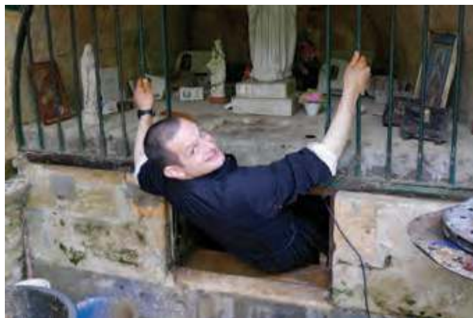
1er mai 2018-nettoyage de la citerne

Je sais que c'est Notre-Dame de Fontpeyrine et personne d'autre – qui m'a rétablie, à sa guise, en son temps et comme bon lui semblait.»