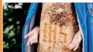
Livret du pèlerin de Fontpeyrine

Le sanctuaire propose désormais aux pèlerins un livret afin de suivre les cérémonies au sanctuaire