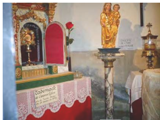
Les élèves de Perpignan En sortie à Pézilla-la-Rivière Miracle des Saintes Hosties