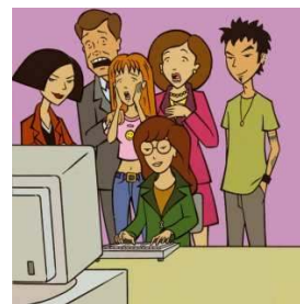
...la famille aujourd'hui

« Souvent tous ces médias au lieu de nous rapprocher, empêchent la communication. »