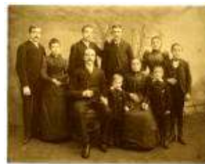
La famille hier...

En ce qui concerne le droit à l'information il faut distinguer la liberté de la presse que les papes ont souvent condamnée parce qu'elle met sur un pied d'égalité vérité et erreurs, et le droit des fidèles à être informés sur tous les sujets. Dans ce second cas, le danger réside dans l'excès d'information qui nuit à la réflexion et à la