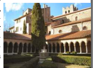
Le cloître d'Arles-sur-Tech

« Cette civilisation amène peu à peu le citoyen à troquer les libertés supérieures contre la simple garantie des libertés inférieures »