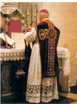
Le Sacerdoce Mgr Lefebvre

« Dans notre lutte contre l'ignorance, nous avons d'immenses progrès à réaliser. »