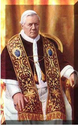
Saint Pie X :

Le relâchement actuel des âmes et leur faiblesse, avec les maux si graves qui en résultent, doit être principalement attribué à l'ignorance des choses divines.