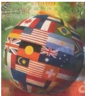
Les médias au service du village global

« Le premier aréopage des temps modernes est le monde de la communication, qui donne une unité à l'humanité en faisant d'elle, comme on dit, un grand village »