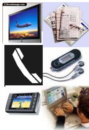
Des médias de plus en plus perfectionnés

« Souvent tous ces médias au lieu de nous rapprocher, empêchent la communication. »