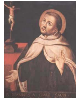
St Jean de la Croix, maître de la vie intérieure

« Même dans nos milieux chrétiens, imbibés de cette ambiance affairiste, les vocations ont peine à surgir. »