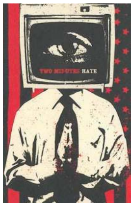
Former à la pensée unique

« Le premier aréopage des temps modernes est le monde de la communication, qui donne une unité à l'humanité en faisant d'elle, comme on dit, un grand village »