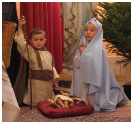
Spectacle de l'Épiphanie de l'école de Fabrègues