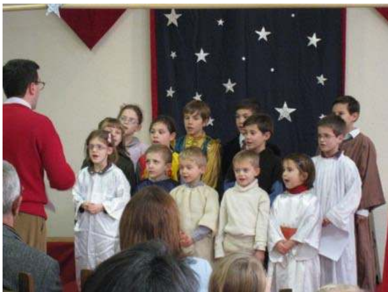
Perpignan Ecole ND du Mont Carmel