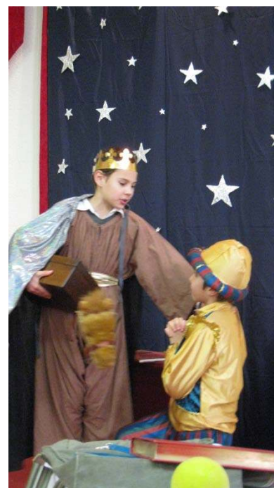
Perpignan Ecole ND du Mont Carmel