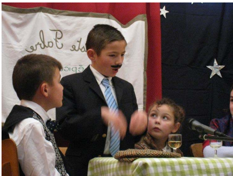
Fabrègues Ecole Saint Dominique Savio

A Perpignan les élèves de l'école Notre Dame du Mont Carmel , et à Fabrègues les élèves de l'école Saint Dominique Savio ont la joie de présenter leur spectacle à leurs parents et amis. Chacun offre son enthousiasme, ses émotions et ses efforts à un public émerveillé par tant de talents.