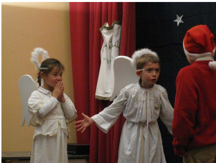
Fabrègues Ecole Saint Dominique Savio