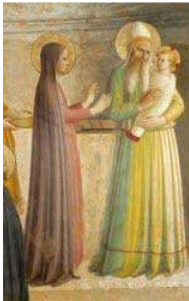
Bx Fra Angelico

Cette année, si Dieu veut, un élève de la première année d'existence du Primaire de Fabrègues sera ordonné prêtre à Ecône : nous y voyons là un grand encouragement à la persévérance !