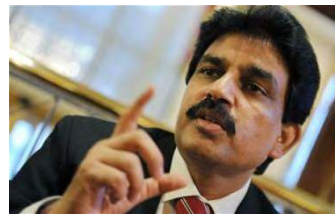
Shahbaz Bhatti Pakistan