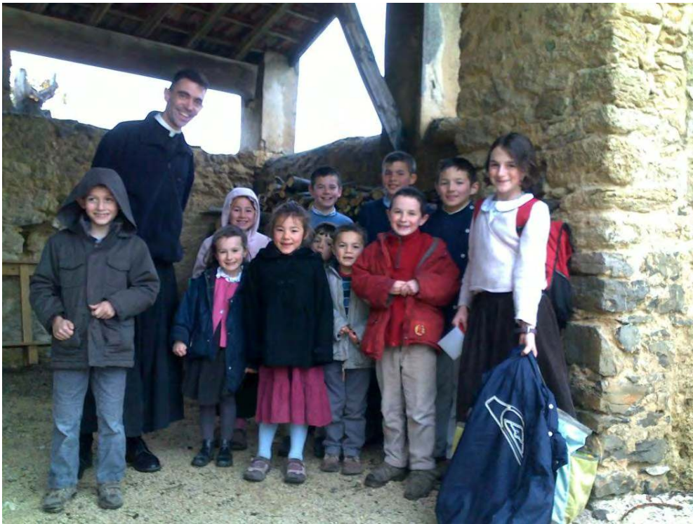
Pour le Carême, les enfants de nos deux écoles offrent tous leurs efforts pour la sanctification d'un prêtre qu'ils ont choisi. Chacun y a mis son cœur pour écrire à « son » prêtre une jolie lettre.