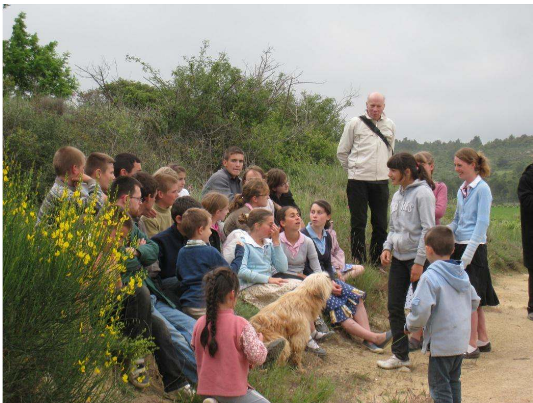
Journée annuelle à Jonquières en l'honneur de Notre-Dame des Grâces