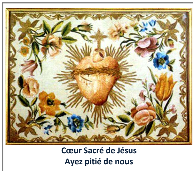
Cœur Sacré de Jésus Ayez pitié de nous