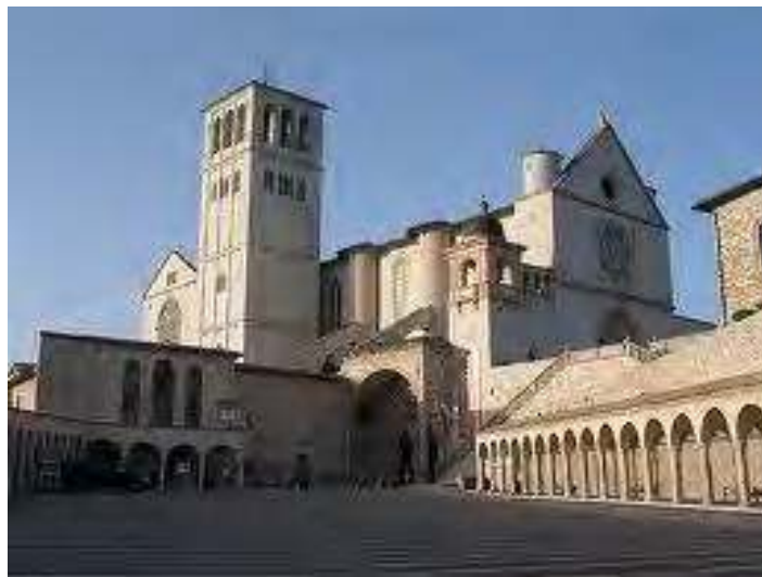
Basilique Saint François d'Assise

A cela, il faut répondre par ces paroles du Christ : « Que votre cœur ne se trouble point : croyez en Dieu, croyez aussi en moi (...) Je vous ai dit ces choses pendant que je demeure avec vous. Mais l'Intercesseur, l'Esprit-Saint que mon Père enverra en mon nom, lui, vous enseignera toutes choses que je vous ai dites. Je vous laisse la Paix, je vous donne ma Paix ; ce n'est pas comme la donne le monde que moi je vous la donne. Que votre cœur ne se trouble pas et ne s'effraie pas ! 5 »