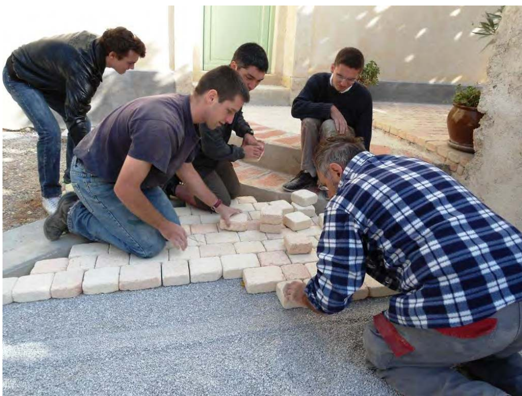
PARVIS DE LA CHAPELLE DE FABREGUES : CONCENTRATION ET DEVOUEMENT. MERCI AUX BONNES VOLONTES