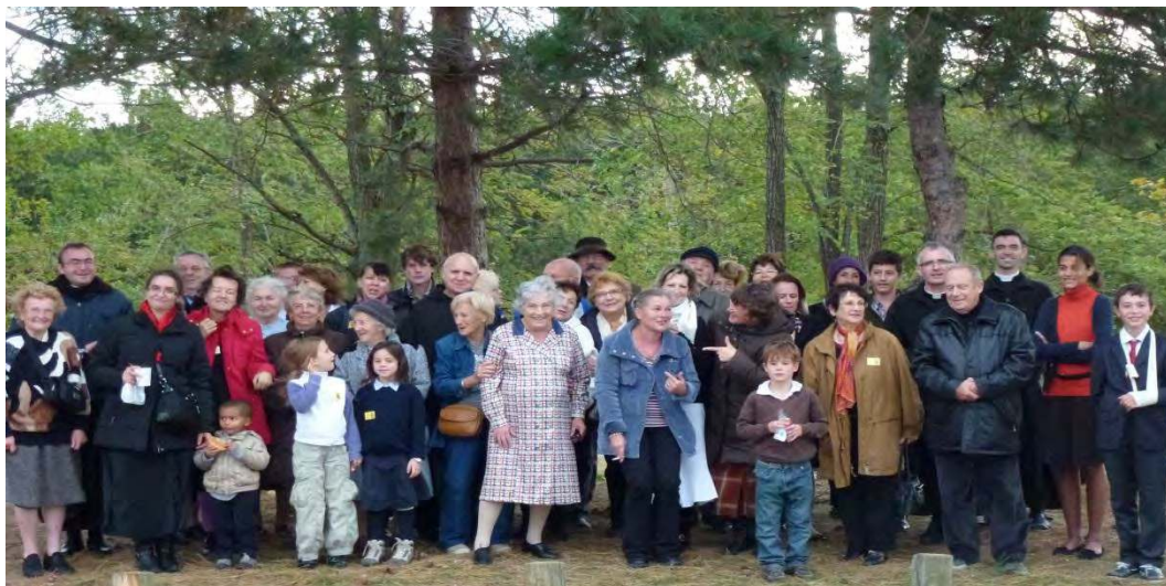
PELERINAGE DE LOURDES : PHOTO D'UN GROUPE DE PELERINS