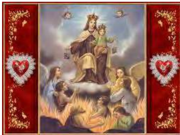
MOIS DES AMES DU PURGATOIRE