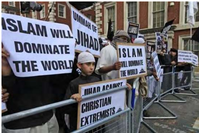
Londres, septembre 2011 : manifestation de musulmans

On ne le croit pas, le peuple est alors exilé à Babylone et à Ninive.