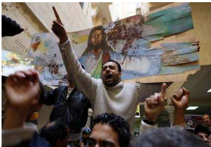
Egypte : Coptes brandissant le reste d'un icône du Christ tâché du sang de chrétiens massacrés par les musulmans

Le pape a réuni à Assise les représentants des fausses religions afin de chercher la paix dans le monde. Profitons de cet événement pour nous rappeler ce qu'enseigne la Parole divine à ce sujet.