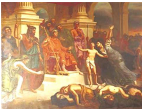
"Mon fils, aie pitié de moi, qui t'ai porté neuf mois. [...] Regarde le ciel et la terre, vois tout ce qu'ils contiennent et sache que Dieu les a créés de rien. Ne crains pas ce bourreau, mais sois digne de tes frères." (III Mach. VII, 27)

C 'est en ce sens que saint Thomas d'Aquin classe comme étant les plus graves, après ceux commis directement contre la charité envers Dieu, les péchés contre la foi : l'hérétique travaille plus directement qu'un autre pécheur à la ruine des âmes ; il ruine l'intelligence, qui est à la base de toutes les actions, même celles de la seule volonté : on ne veut que ce qu'on connaît, on n'aime que ce qu'on connaît. Saint Polycarpe ramena plusieurs hérétiques de Rome à leur devoir par la force de sa doctrine et par la sainteté de ses exemples; puis il reprit le chemin de Smyrne pour veiller sur son troupeau, et, comme un bon pasteur le garantir contre la rage des loups infernaux.