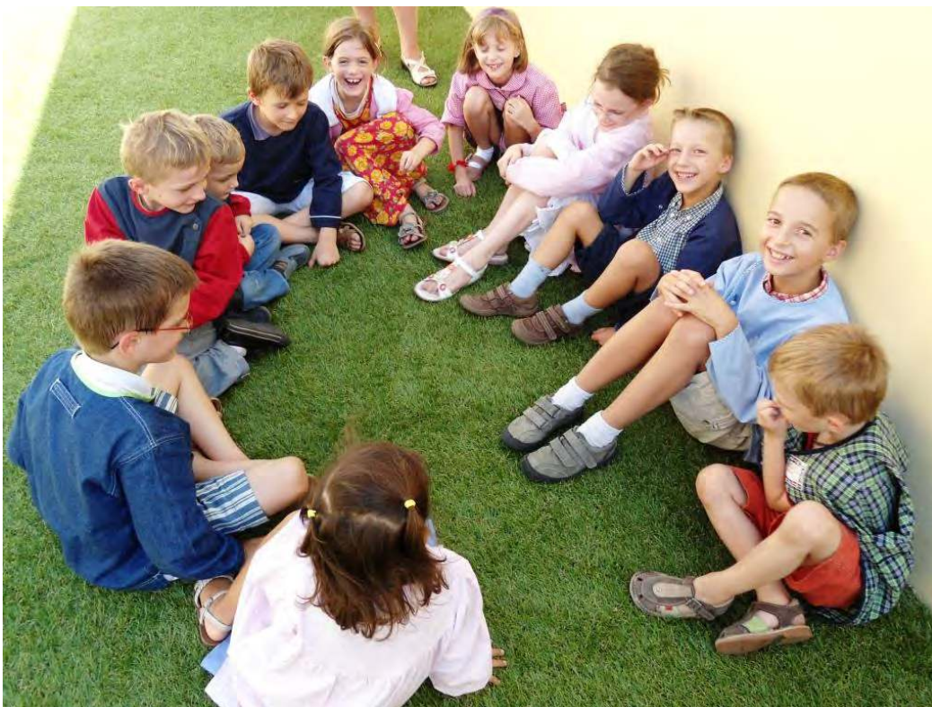
ECOLE DE PERPIGNAN : DETENTE OU REFLEXION ?

Le Prieuré n'est pas le cadre où sommeillait la Belle au bois dormant .... Qu'on en juge !