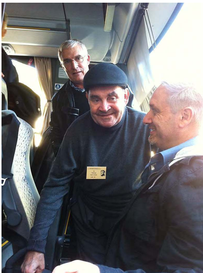
UN RESIDENT DE LA MAISON DE RETRAITE DE PERPIGNAN ET LES ACCOMPAGNANTS, LORS DU PELERINAGE A LOURDES LES 22, 23 ET 24 OCTOBRE DERNIER