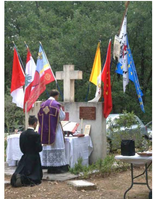
MESSE AU RASSEMBLEMENT DU SOUVENIR CATHOLIQUE EN LANGUEDOC A SAUSSINES