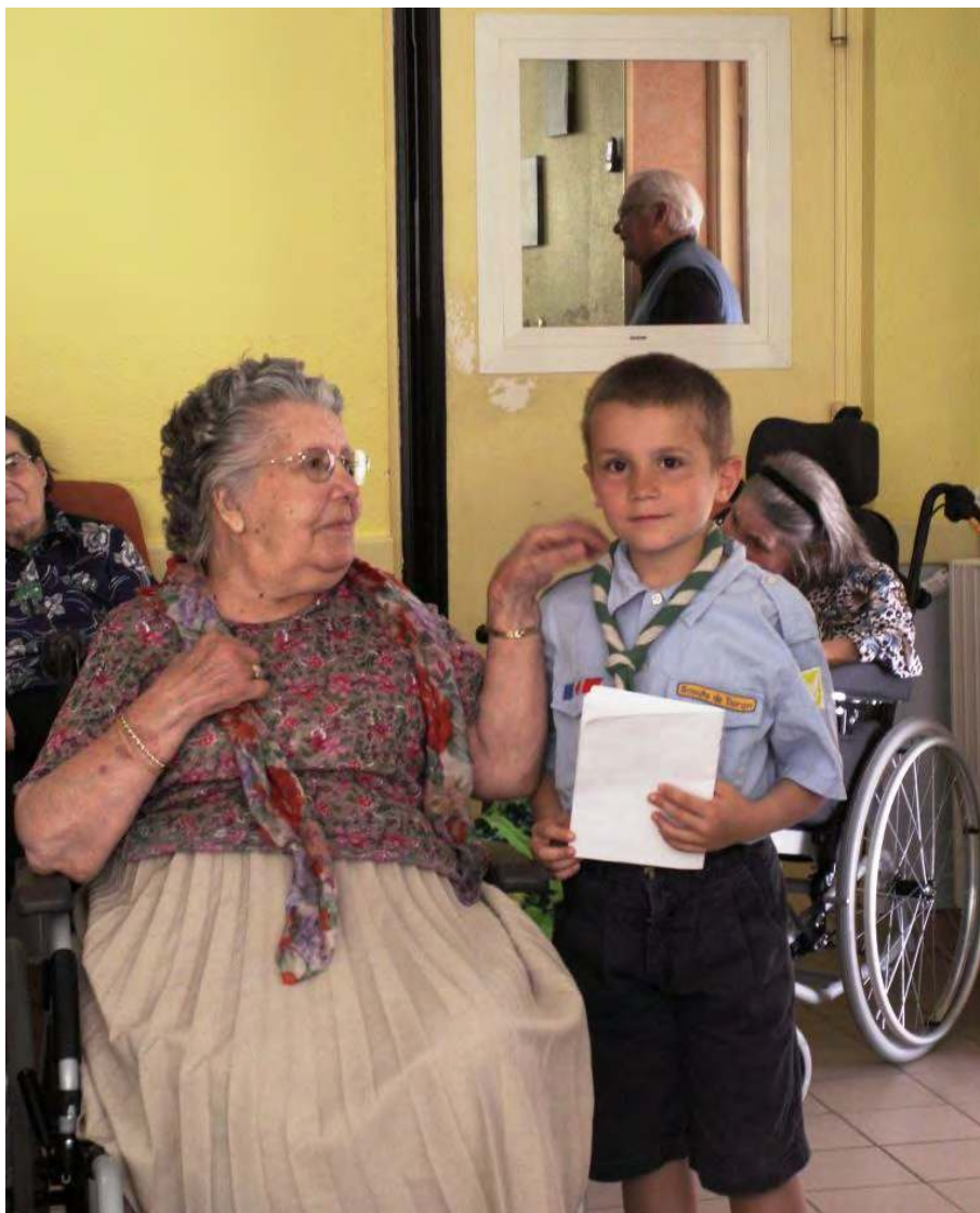
LES LOUVETEAUX DE FABREGUES AUPRES DES PERSONNES AGEES

Dimanche 5 mai ! Enfin le beau jour de la première communion est arrivé pour la plus grande joie des familles, la plus grande satisfaction des abbés qui voient le fruit d'un an de travail apostolique s'éclorre, mais aussi et surtout pour les enfants qui d'un coup, d'un seul, franchissent une étape