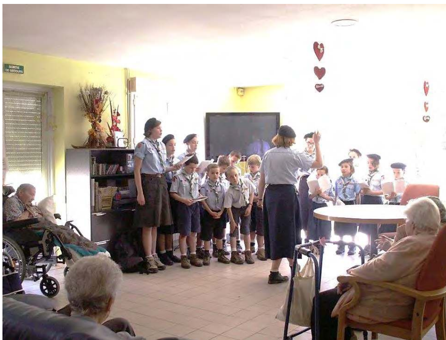
DE NOTRE MIEUX ! LES SCOUTS DE FABREGUES CHANTENT A LA MAISON DE RETRAITE DE FABREGUES

spirituelle importante. Nos amis perpignanais reçoivent la même grâce à l'occasion de la première intimité de Jésus Hostie avec l'une de leurs chères « têtes blondes ».