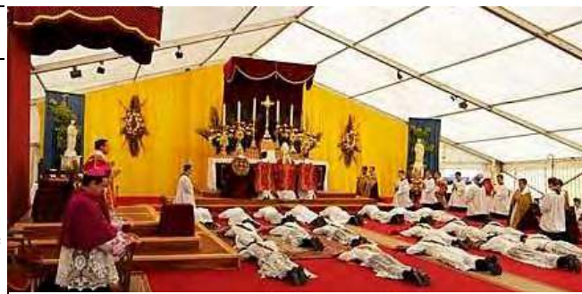
VENDREDI 28 JUIN : ORDINATIONS A ECONE