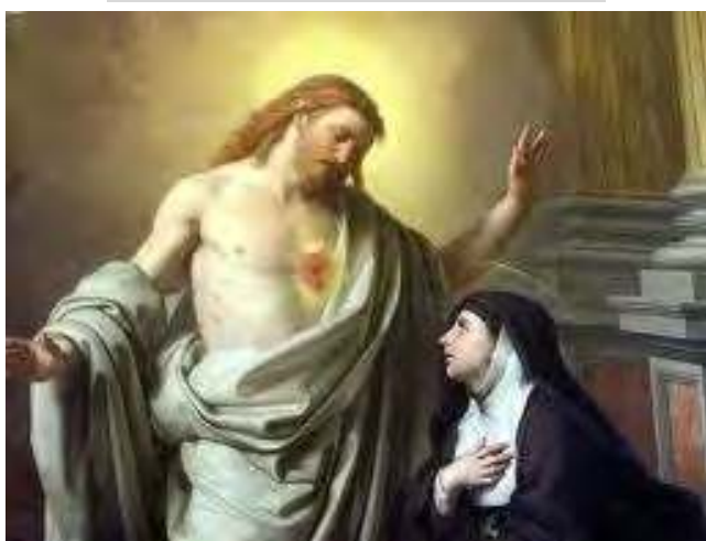
SAINTE MARGUERITE-MARIE (1647-1690)

Cette éducation se reçoit par héritage : celui de la civilisation chrétienne ; ceci est le réalisme catholique ! Et non par un pur code de règles civiques, sorti d'un idéalisme déraciné.