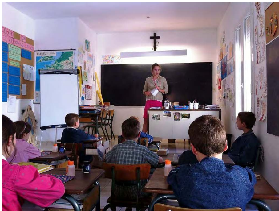
ECOLE DE PERPIGNAN : INTERVENANTE DU CLUB DE LECTURE PLAISIR DE LIRE

En cette journée des travaux du samedi 20 avril , l' enthousiasme de nos paroissiens ne se dément pas. Ils sont sur tous les fronts, sur toutes sortes de tâches, avec la même efficacité et le même entrain. Je les suspecte d'avoir relu ses vers enthousiastes du poète Lamartine : O travail ! Sainte loi du monde... Ton mystère va s'accomplir.