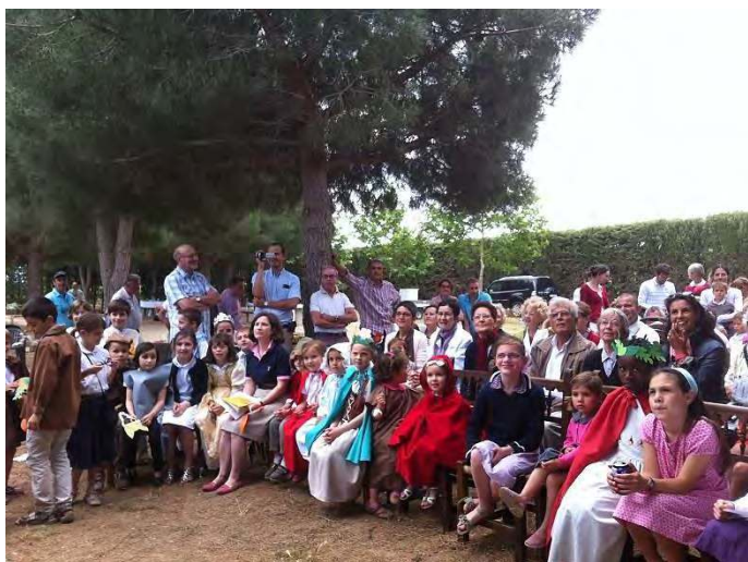
FETE DE L'ÉCOLE ND DU MONT CARMEL : LE SPECTACLE