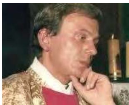
ABBE JERZY POPIELUSZKO (1947 - 1984)

courage, lorsqu'elle se ment à elle-même ».