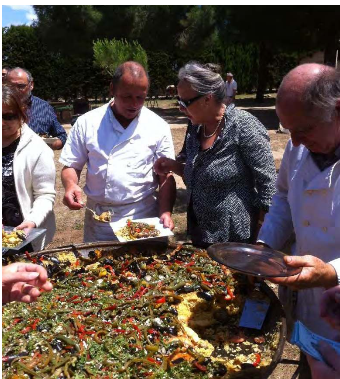
KERMESSE DE PERPIGNAN, LA TRADITIONNELLE PAELLA