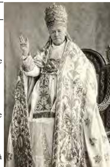
3 SEPTEMBRE SAINT PIE X PAPE ET CONFESSEUR