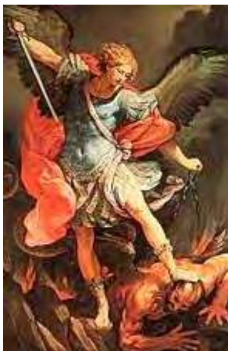
SAINT MICHEL ARCHANGE

Par la foi, Dieu appelle à sortir de sa propre terre et à s'ouvrir à une vie nouvelle comme Il l'a fait pour Abraham. Et la Parole de Dieu est accompagnée d'une promesse de salut. A nous d'écouter cet appel, et d'y répondre chaque jour par amour. La fidélité est porteuse de vie , comprenons-le bien !