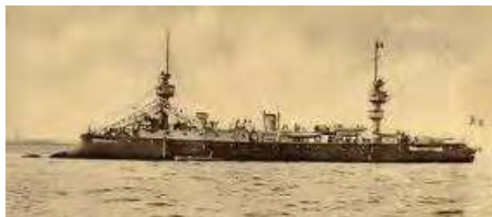
CRUISEUR AMIRAL CHARNER