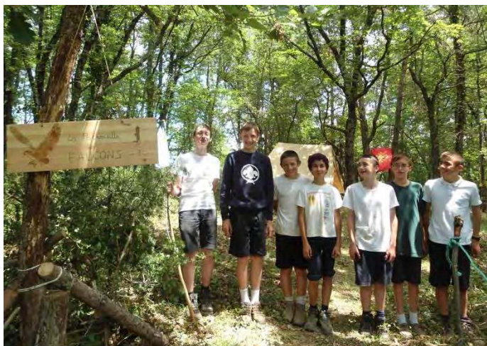
CAMP SCOUT : LA PATROUILLE DES SCOUTS DE FABREGUES

Quel bonheur de se retrouver sous les ombrages, après la messe chantée de ce dimanche 23 juin ! Il faut dire que l'école ND du Mont Carmel n'a pas lésiné sur les moyens pour satisfaire les invités de sa kermesse : un festin de roi, des stands plus alléchants les uns que les autres, des jeux et un spectacle des élèves.