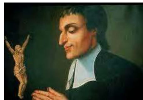
SAINT LOUIS-MARIE GRIGNON DE MONTFORT