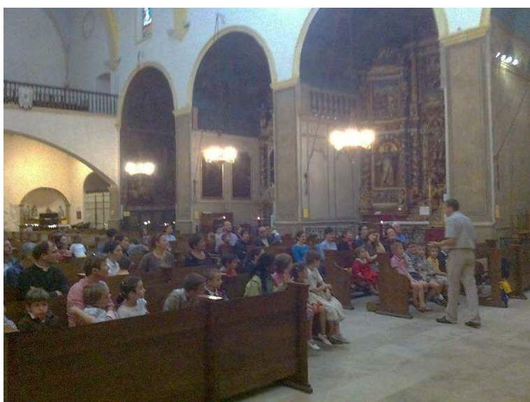
ECOLE DE PERPIGNAN : VISITE DE L'ÉGLISE DE COLLIOURE

tage de Consolation -, des jeux pour les enfants, sans oublier une profonde piété font de cette journée un merveilleux moment d'unité et de réconfort. Le frère pendant ce temps, représente le prieuré aux premiers vœux des frères à Flavigny .