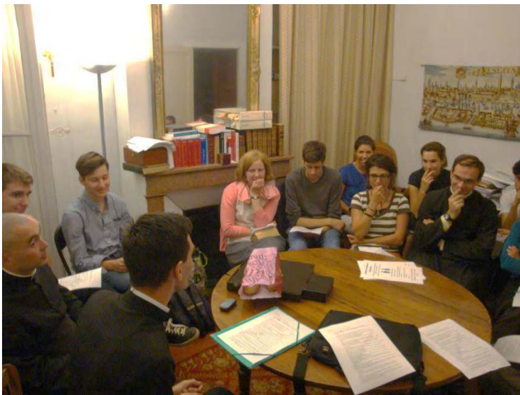
GRUPE DES ETUDIANTS CATHOLIQUES DE MONTPELLIER