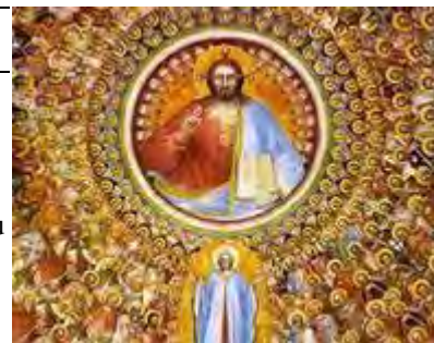
1ER NOVEMBRE : FETE DE LA TOUSSAINT