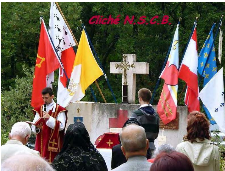
SAUSSINES : MESSE EN MEMOIRE DES VICTIMES DE LA REVOLUTION

D'une belle façon puisqu'elle souligne le désir de sanctification de votre communauté , la récollection mensuelle de notre communauté du mercredi 17 septembre ouvre cette chronique. Pendant quelques heures, vous avez pu perdre un appel téléphonique... c'est vrai ! Mais quel plaisir de retrouver vos prêtres ressourcés par leur proximité avec le Divin maître !