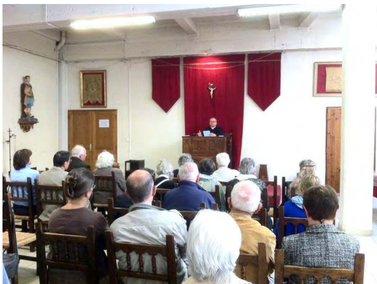
RECOLLECTION PRECHEE PAR M. L'ABBE DELAGNEAU