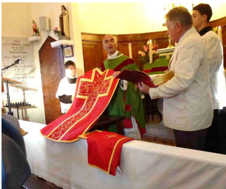
NOUVEL ORNEMENT POUR LA CHAPELLE DE BOIRARGUES !