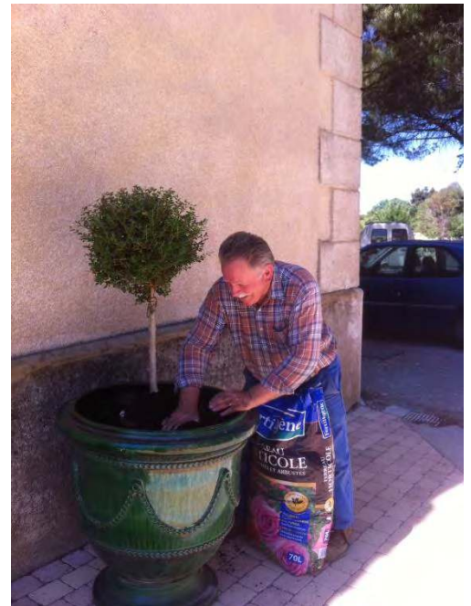
ENTRETIEN DU PRIEURE