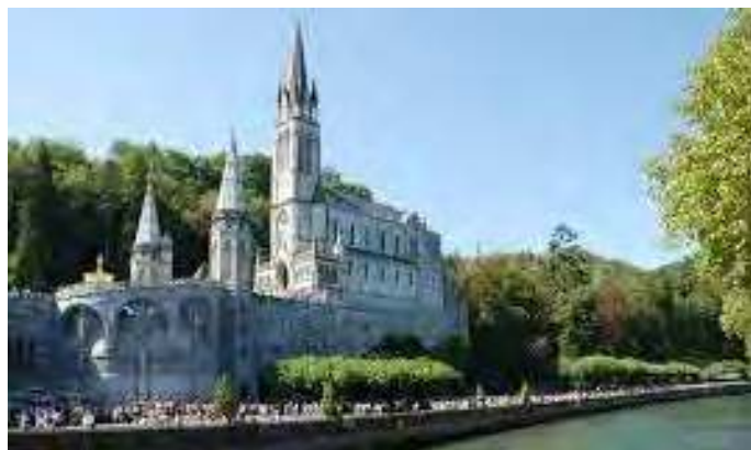
PELERINAGE DU CHRIST-ROI A LOURDES LES 25,26 ET 27 OCTOBRE CENTENAIRE DE LA MORT DE SAINT PIE X