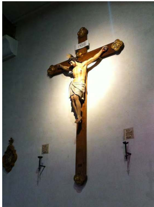
FABREGUES : ECLAIRAGE DU CRUCIFIX