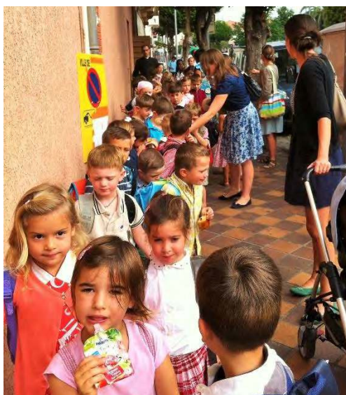
SORTIE DE MESSE A L'ECOLE DE PERPIGNAN

Ces considérations sur la reprise de nos activités ne nous font oublier ni le travail d'entretien de nos bâtiments - car malgré la période estivale, vous avez répondu à l'appel du prieur -, ni la