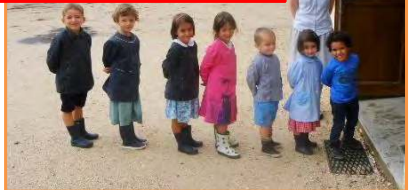
ET TOUJOURS AVEC LE SOURIRE !