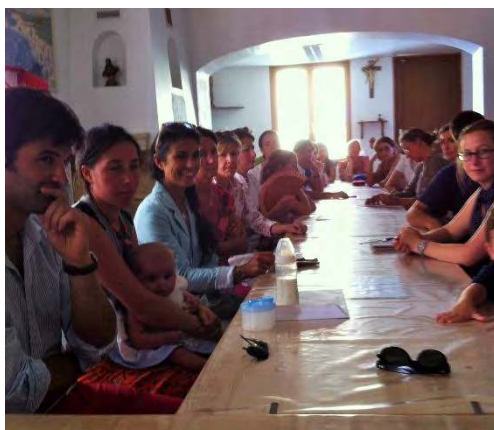
REUNION DES PARENTS D'ELEVES A PERPIGNAN