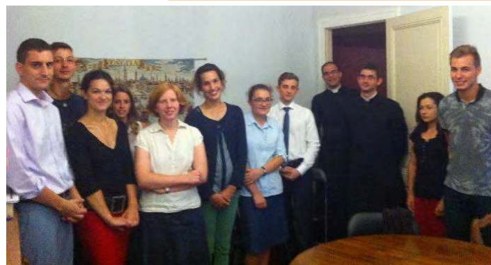
MONTPELLIER RENTREE DES ETUDIANTS

L'énergie de ces jeunes gens est-elle la cause du flou de la photo ?