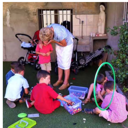
... ET LES GARCONS JOUENT PAISIBLEMENT