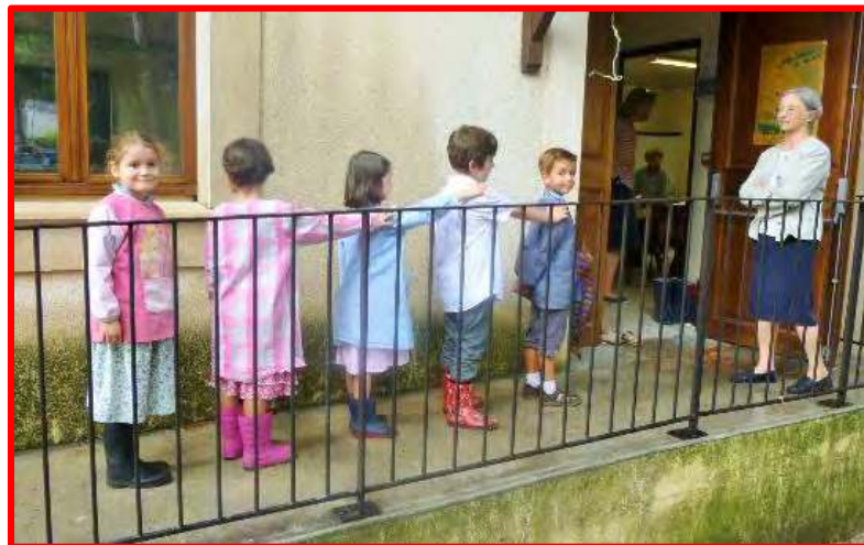
FABREGUES C'EST L'HEURE DE LA CLASSE