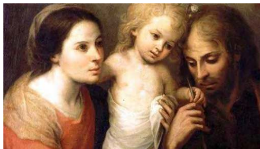
LA SAINTE FAMILLE