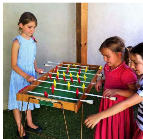
RECREATION A PERPIGNAN : LES FILLES S'ENTRAINENT !...