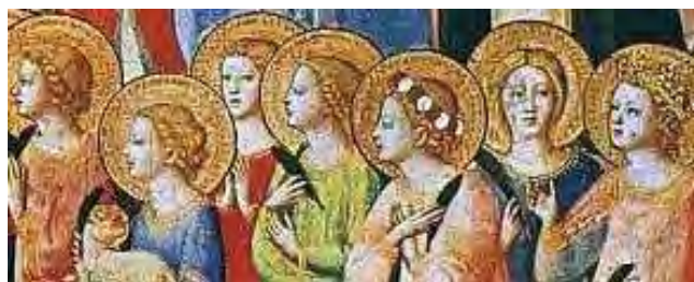
SAMEDI 1 ER NOVEMBRE FETE DE TOUS LES SAINTS