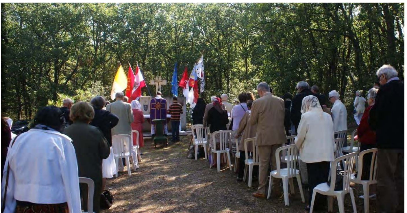
MESSE A SAUSSINES : FRANCE, SOUVIENS-TOI ! EN 1000 ANS, LE ROI N'EST MORT QU'UNE FOIS.