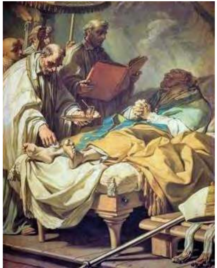
ST FRANCOIS DE SALES RECEVANT L'EXTRÊME-ONCTION

n'attendez pas ! Faîtes savoir autour de vous que vous souhaitez recevoir l'Extrême-Onction... Sans attendre d'être inconscient ou peut être mort... Ainsi reçues avec un grand esprit de foi et avec confiance, les grâces seront abondantes pour accepter la volonté du Bon Dieu.