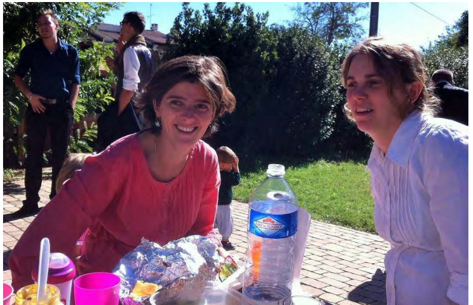
REPAS D'ADIEU DE LA FAMILLE D'ARMAGNAC AU PRIEURE DE FABREGUES