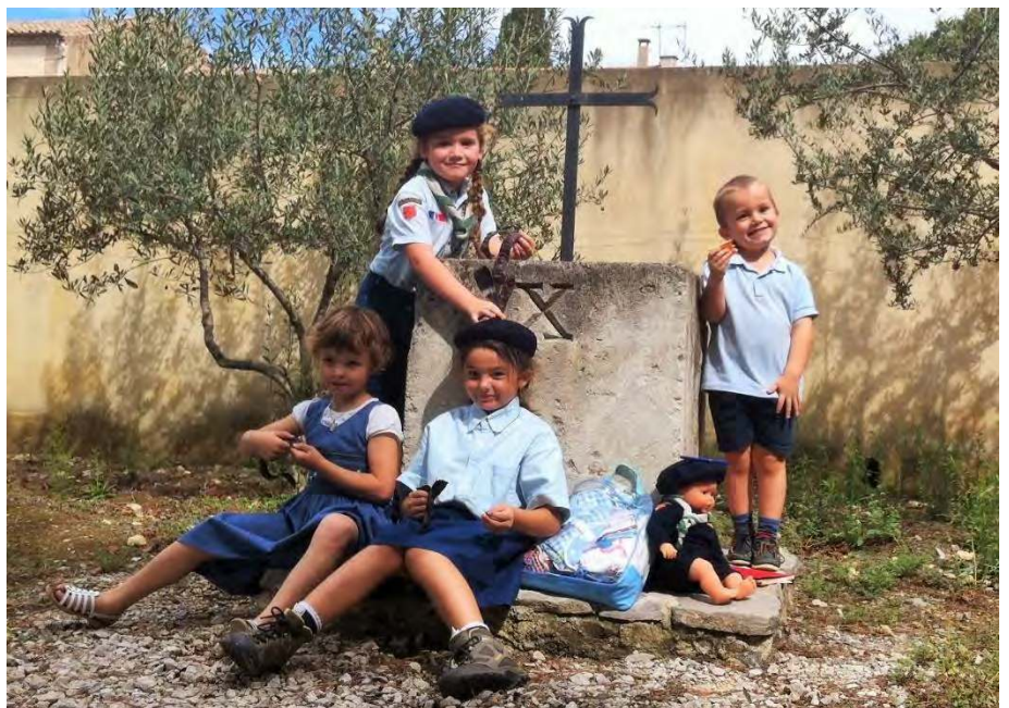
RENTREE DES LOUVETEAUX ET LOUVETTES A FABREGUES. EN BAS A DROITE LE PLUS JEUNE DE FRANCE ?