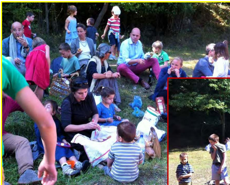
ECOLE ND DU MONT CARMEL