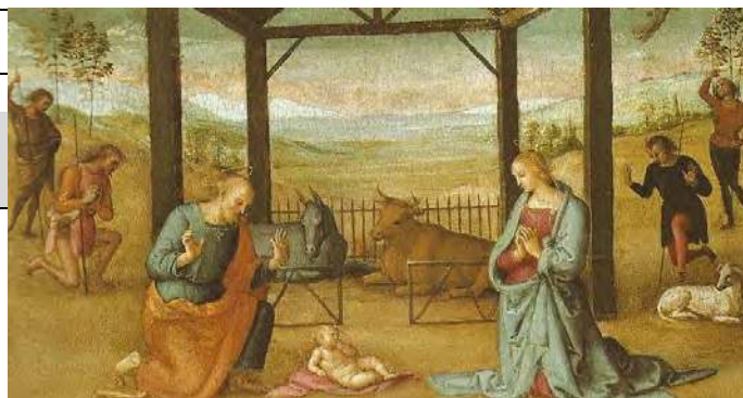
JEUDI 25 DECEMBRE : NATIVITE DE NOTRE-SEIGNEUR LA NATIVITE PAR PERUGINO (DETAILS)