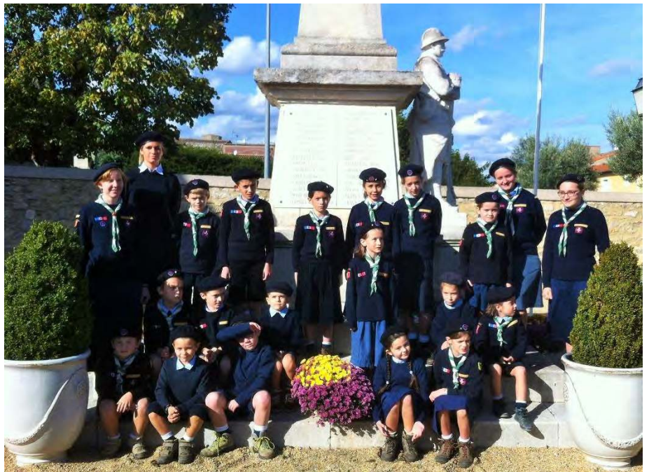
11 NOVEMBRE A FABREGUES : NOS LOUVETEAUX RENDENT HOMMAGE AUX MORTS POUR LA FRANCE ET PRIENT POUR EUX