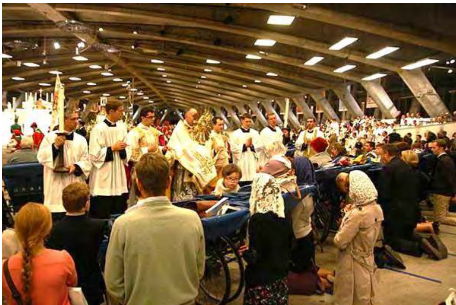
EXTRAORDINAIRE, SUBLIME PELERINAGE DU CHRIST-ROI A LOURDES, DANS LA FOI, LA SERENITE ET LE FEU DE LA CHARITE