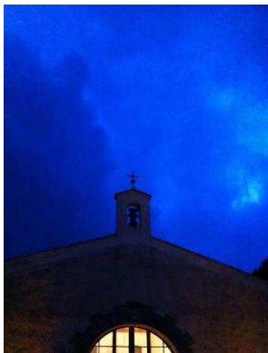
SOIR DE TEMPETE AU-DESSUS DU CLOCHER DE FABREGUES