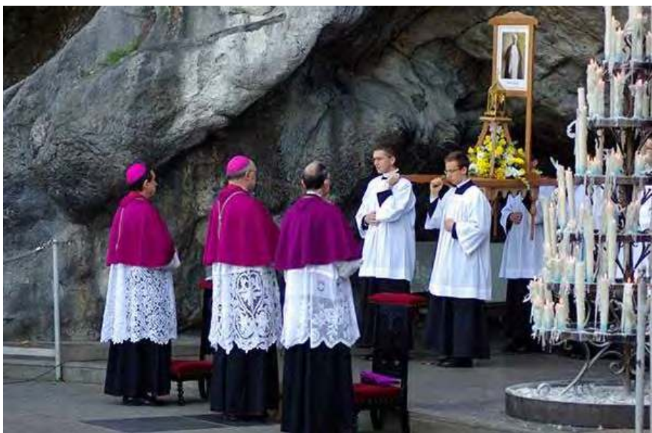
A LA GROTTE, SUPPLIQUE A SAINT PIE X LUE PAR LES TROIS EVEQUES DE LA FRATERNITE