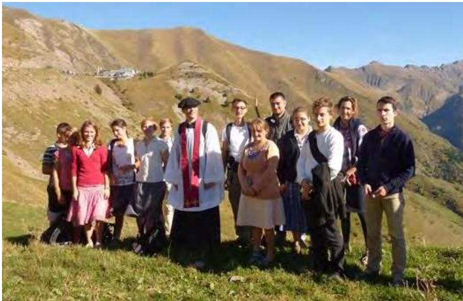
NOS JEUNES PAROISSIENS A LA SALETTE, HAUT LIEU D'APPARITIONS DE NOTRE-DAME

Le lendemain dimanche, un événement inhabituel pour Fabrègues retient notre attention... Les fidèles sont invités à ne pas quitter leur place pour profiter d'une répétition de grégorien. La messe des défunts est ainsi revue pendant une quinzaine de minutes. Le même jour, fruit consolant des réunions d'étudiants, la première communion d'une demoiselle qui la semaine prochaine se fiancera à Avignon, sous le regard bienveillant du prier. La preuve du bienfait des Cercles de la Tradition ou Cercles des Jeunes Familles ou Catéchismes pour adultes .