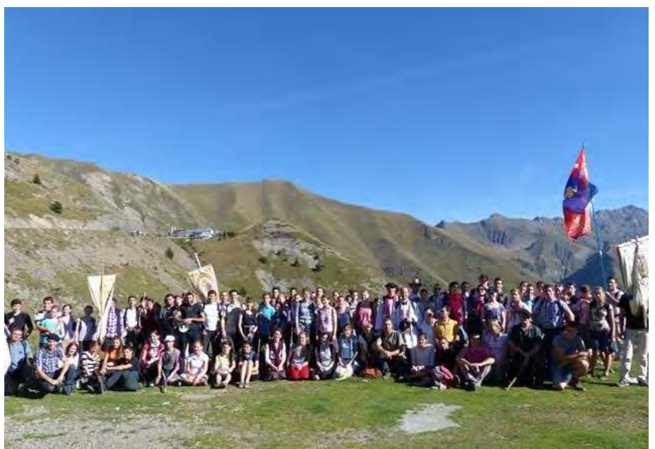
POUR TERMINER REVENONS A LA SALETTE AU MESSAGE TERRIBLEMENT ACTUEL