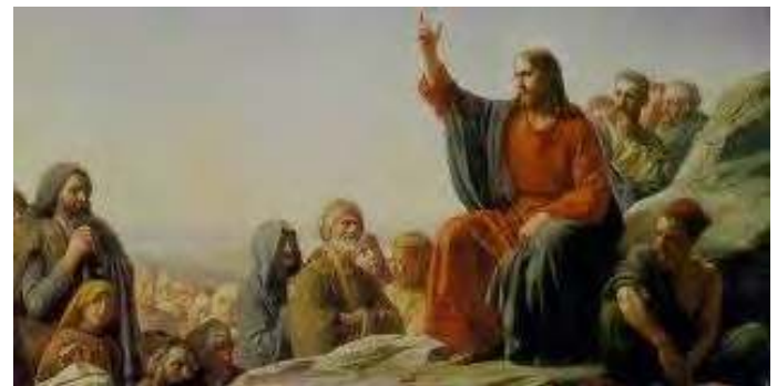
JESUS ENSEIGNANT LES FOULES

Je te donnerai les clefs du Royaume des cieux 2 : l'Eglise