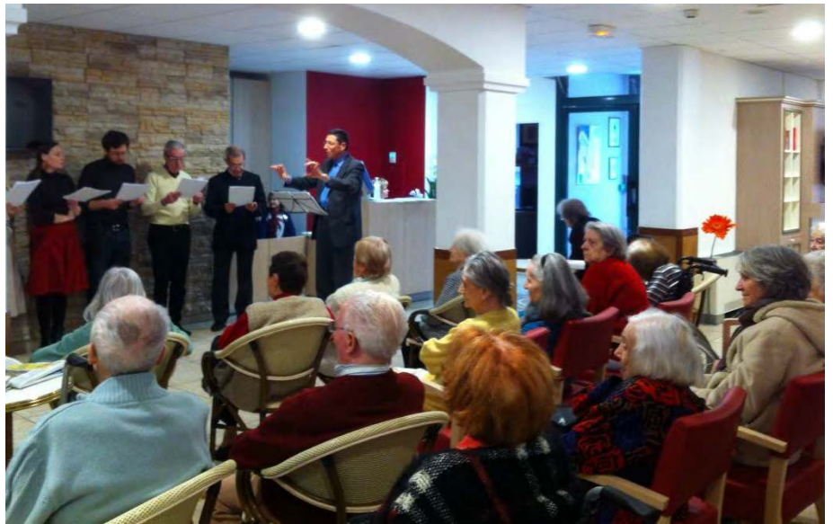
... A LA MAISON DE RETRAITE KORIAN DE PERPIGNAN