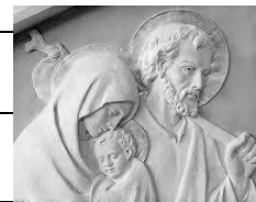
MOIS DE SAINT JOSEPH