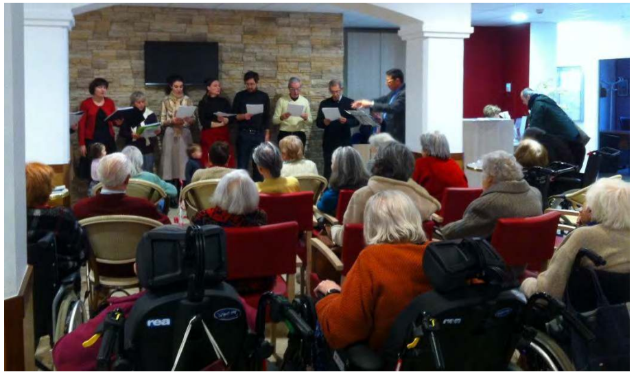
CONCERT DE NOEL ET JOIE POUR NOS ANCIENS ...

En fin d'après-midi, les élèves vont oublier pendant 15 longs jours les subtilités de la proposition indépen-