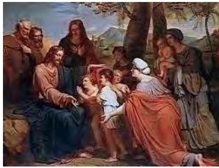
JESUS BENISSANT LES ENFANTS

V aste programme, diront certains, après avoir eu le courage de lire jusqu'au bout toutes ces conditions.