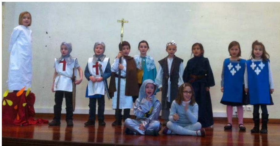
ND DU MONT CARMEL – EVOCATION DU MARTYRE DE STE JEANNE D'ARC PAR LE CP ET CE1

Nos étudiants, ce mardi 20 janvier, se régalaient avec un cours d'histoire de la philosophie mais ils se délectent avec les pizzas qui suivent. Heureux sommes nous : des mamans veillent !