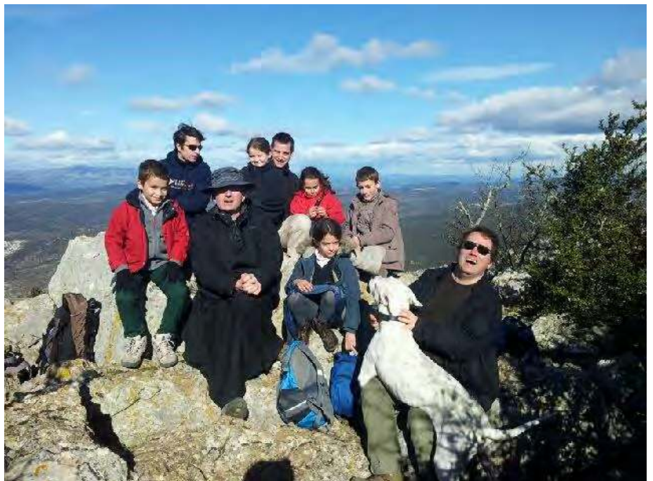
RANDONNEE AU PIC SAINT LOUP