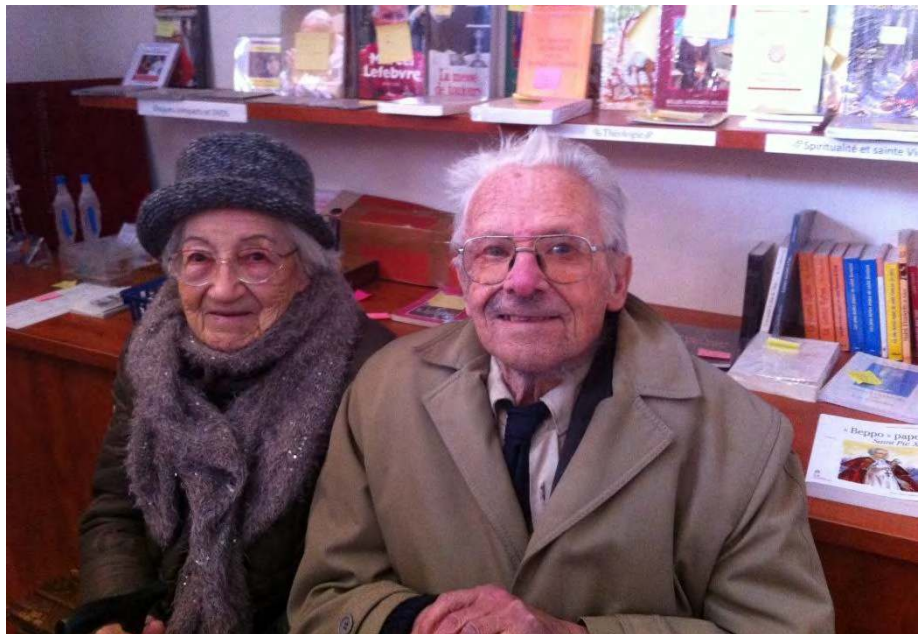
LES DOYENS DE NOS FIDELES DE FABREGUES A LA SORTIE DE LA MESSE DOMINICALE