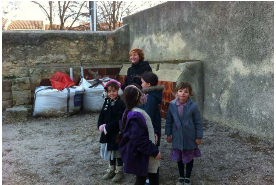
BRRR ! IL FAIT FROID AUSSI DANS LE SUD ! (ECOLE ST DOMINIQUE SAVIO DE FABREGUES)