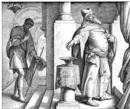
LE PHARISIEN ET LE PUBLICAIN (G.DORE)

présence de Dieu, et, évidemment, combattre la tendance contraire à résister à l'élévation de notre âme.