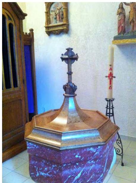
COUVERCLE DU BAPTISTERE DE PERPIGNAN REALISE PAR LE FRERE JEAN-PHILIPPE, EBENISTE A FLAVIGNY