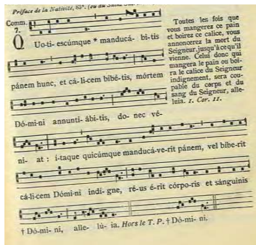
Antienne de communion Messe du Très Saint Sacrement