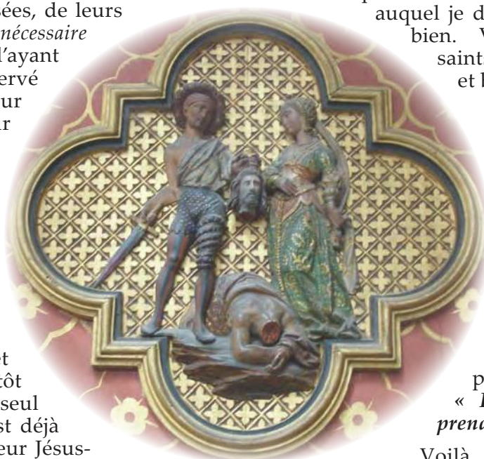
Martyre de st Jean-Baptiste Cathédrale d'Amiens

Voilà récapitulée en quelques coups de pinceaux la vie et la mort du cousin de Notre-Seigneur. Ce message est pour notre temps, comme il le fut