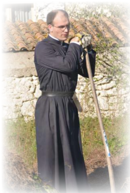
On a bien travaillé !